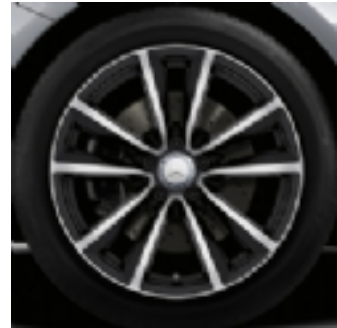
01R - cerchio in lega 18"