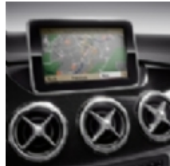
527 Comand OnLine