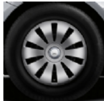
643 - cerchio comfort 16"