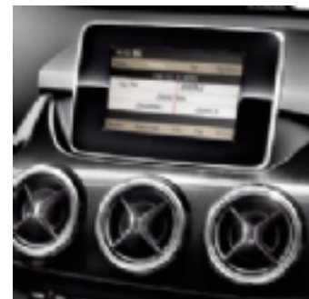
cod. 523 Audio 20CD

Audio 20 CD con lettore CD, tastiera telefonica e vivavoce Bluetooth integrato e lettore MP3 (cod. 523)