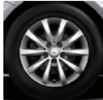
55R - cerchio in lega 16"