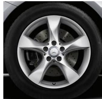
R24 cerchio in lega 17"