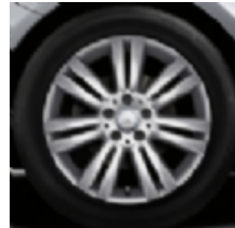
26R - cerchio in lega 17