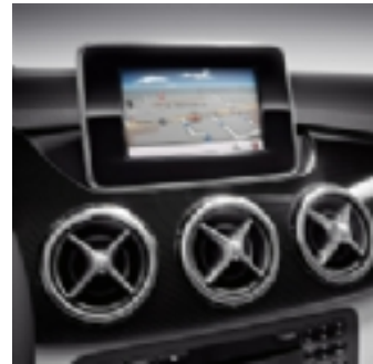
509 Becker Map Pilot

Navigatore Becker MAP PILOT per Audio20 CD (cod. 509)