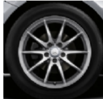
R43 cerchio in lega 17