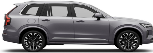
745 Aurora Silver