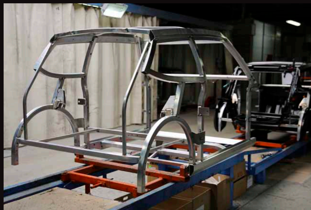
| Telaio: cellula di sicurezza in alluminio