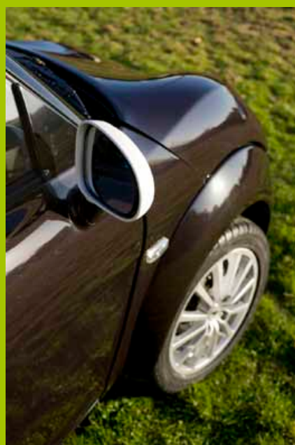
Nuovi retrovisori e ripetitori laterali