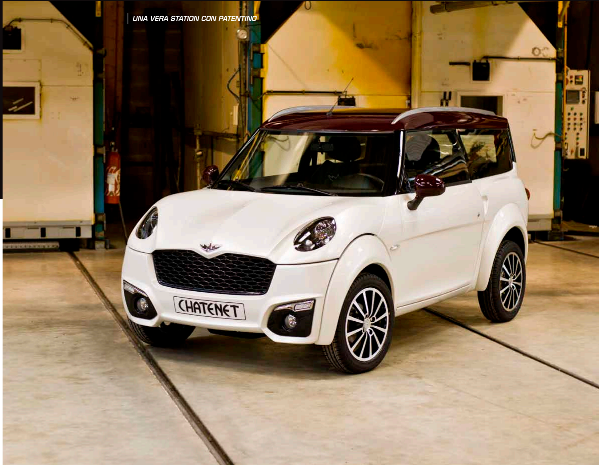
UNA VERA STATION CON PATENTINO

Che voi la utilizzate per raggiungere il posto di lavoro o per una gita nel week end, CH32 è il quadriciclo per tutte le situazioni.