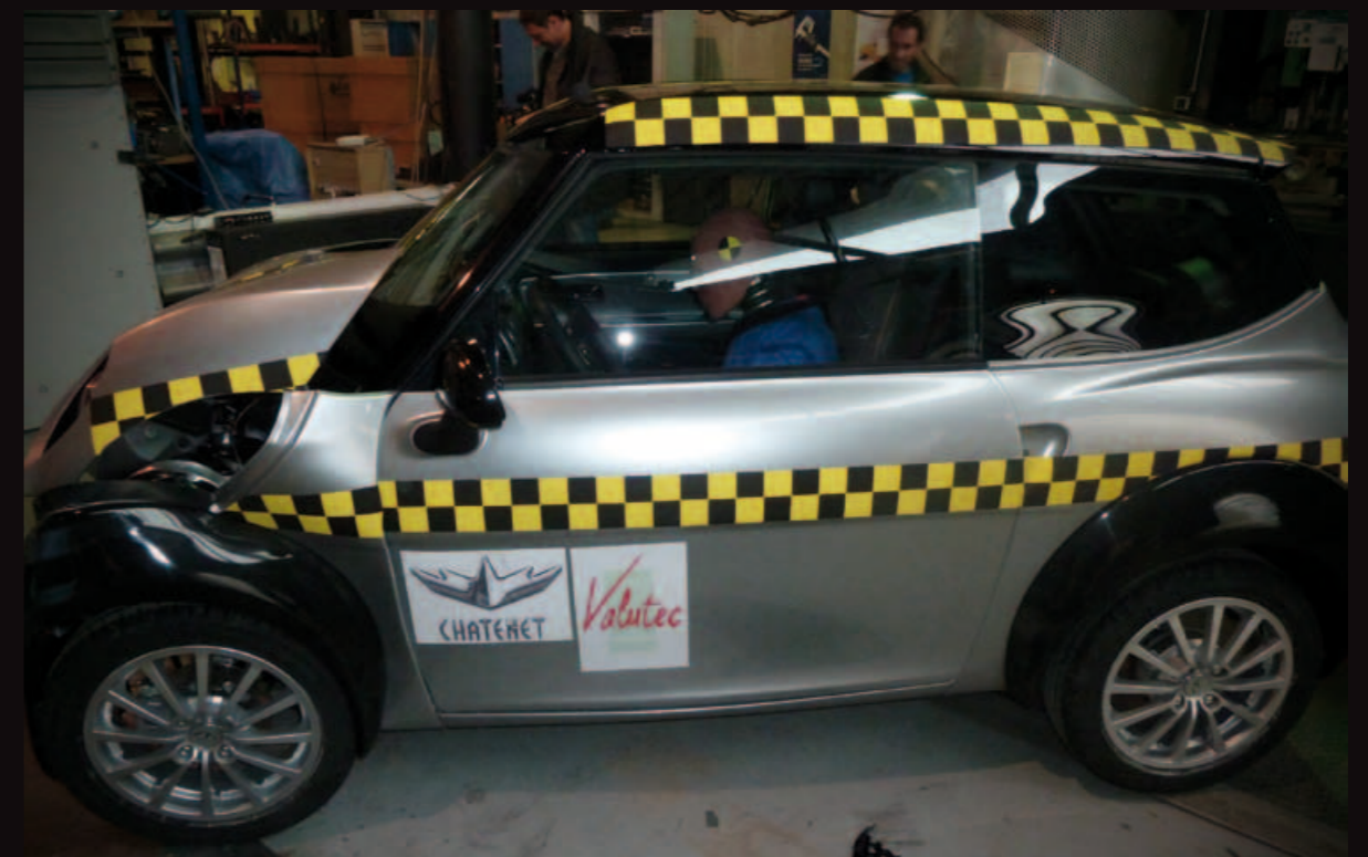
Prova impatto frontale su barriera CEVE realizzata a una velocità di 38,4 km/h

La cellula di sopravvivenza resta intatta dopo l'urto, l'insieme dei vetri del quadriciclo ha resistito all'impatto e l'apertura delle porte è stata eseguita senza problemi.