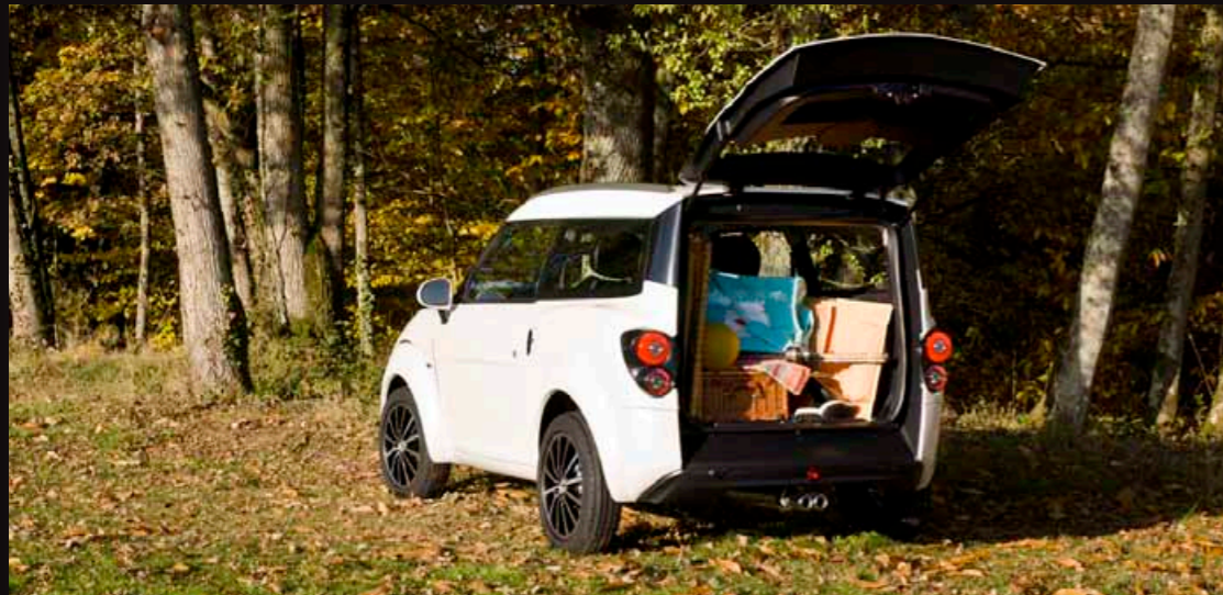
Volume di carico di 800 litri