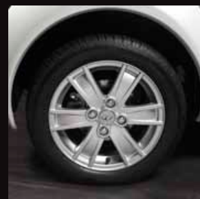
| Cerchi in lega 14"