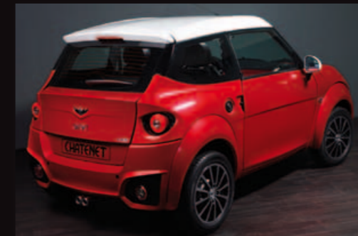
Nuovo look posteriore del quadriciclo