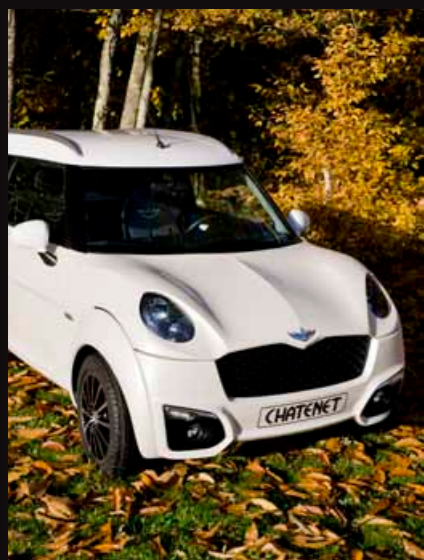
Nuova fisionomia della parte anteriore

Con il suo design elegante e la sua polivalenza, offre la possibilità di raggiungere tutte le destinazioni a vostra scelta