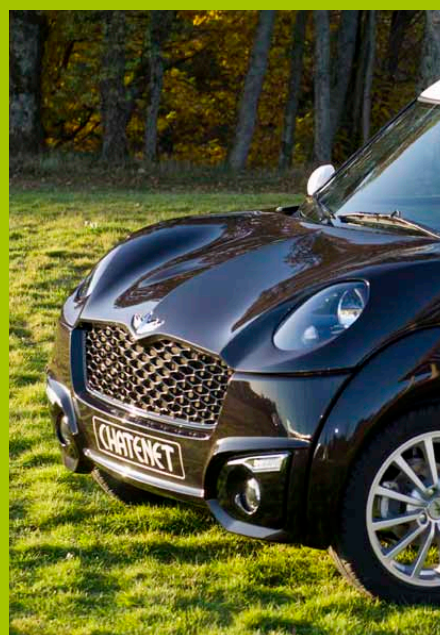
Un frontale aggressivo