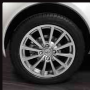
| Cerchi in lega 15"