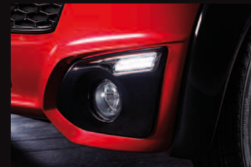
Fanali anteriori con illuminazione a led

La nuova CH26 si differenzia in design singolare, sportività, eleganza in tutte le circostanze.