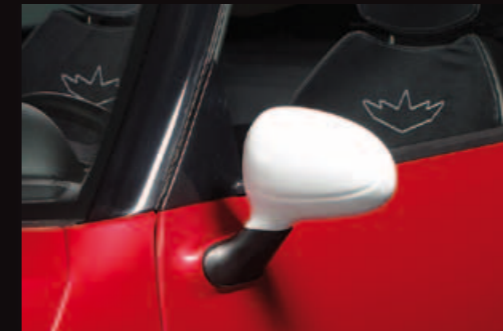
Aumento di visibilità