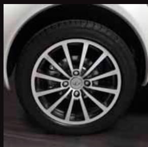
| Cerchi in lega 15" diamantati