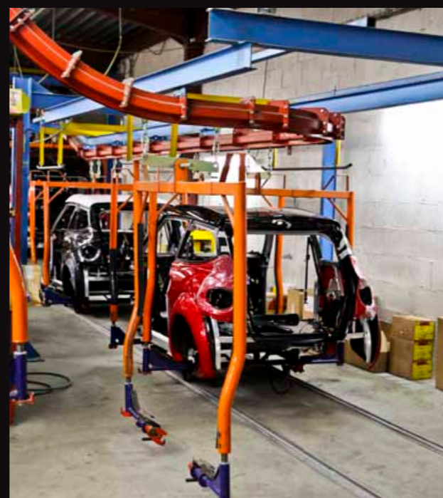
| Catena di montaggio automobilistica