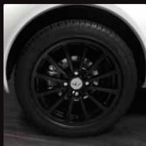
| Cerchi in lega 15" nero