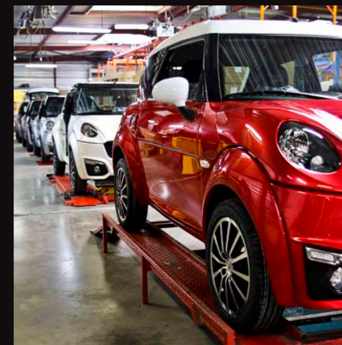
| Fabbricate in Francia