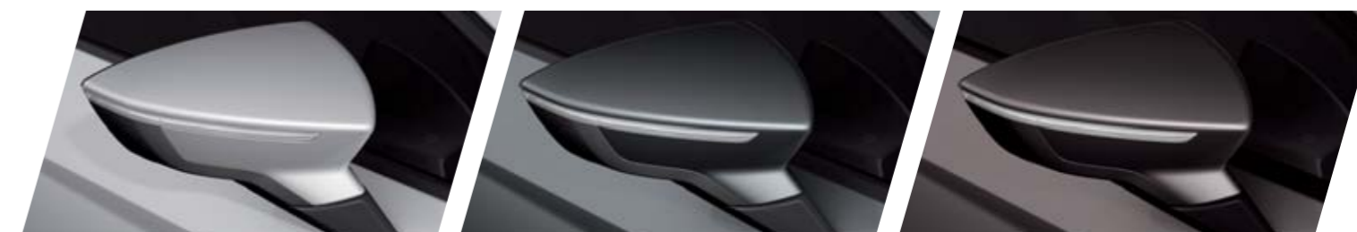
ARGENTO GHIACCIO P5P5 METALLIZZATO R St FR