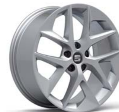
18" 30/1 CERCHI IN LEGA PERFORMANCE FR