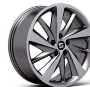
18" 30/2 CERCHI IN LEGA PERFORMANCE TITANIUM MACHINED FR

Reference /R/ Style /St/ FR /FR/ Di serie ■ Optional ■