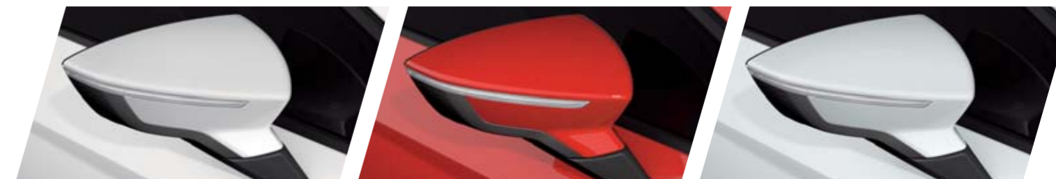
BIANCO B4B4 PASTELLO R St FR