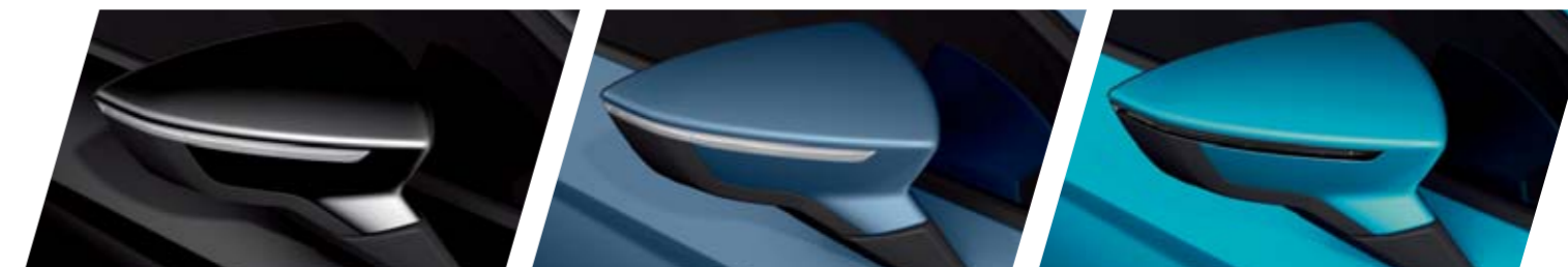
NERO PHANTOM L8L8 METALLIZZATO R St FR