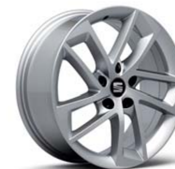
17" 30/1 CERCHI IN LEGA DYNAMIC ST