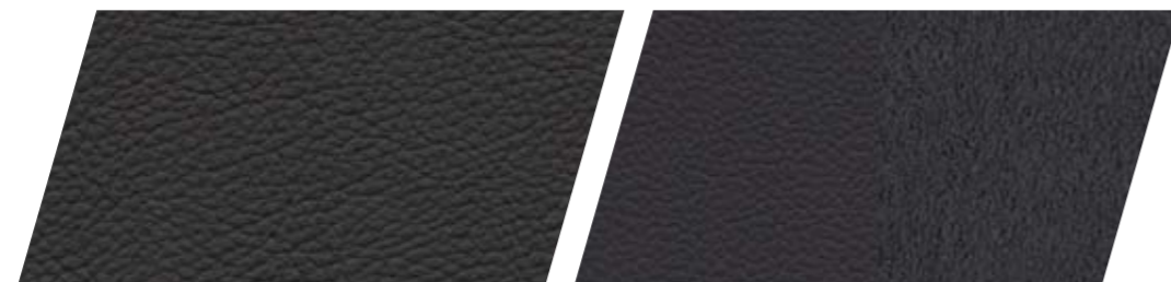
PELLE COFFEBLACK AH PL1**1 / CP PL1 2 St FR 2