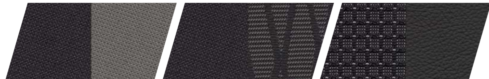
TESSUTO FALSET III COFFEBLACK/MUNDAKA AH R