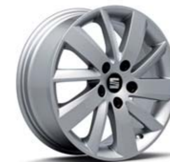
16" 30/1 CERCHI IN LEGA DESIGN FR