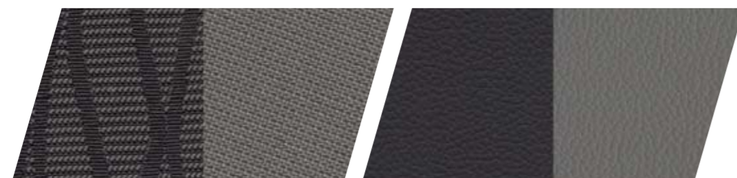
TESSUTO ONA COFFEBLACK/MUNDAKA AG PLE St