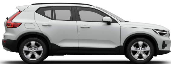
614 Ice White