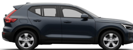
723 Denim Blue