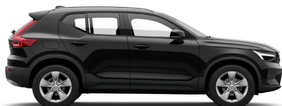
717 Onyx Black