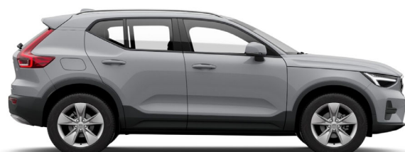
740 Vapour Grey