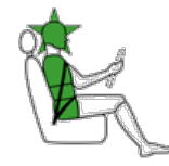
Conducente in impatto laterale