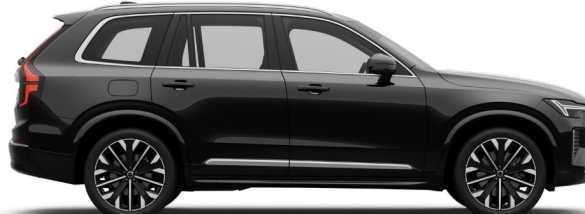
717 Onyx Black