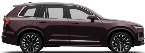
739 Mulberry Red