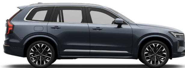
723 Denim Blue