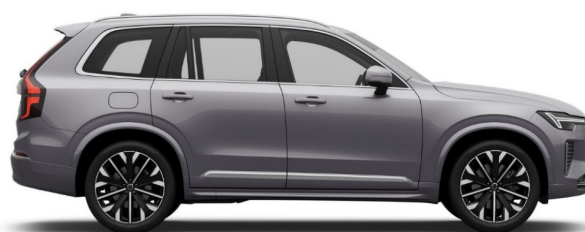
745 Aurora Silver