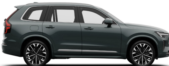
746 Forest Lake