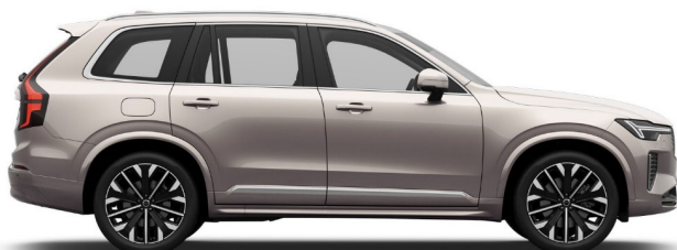
736 Bright Dusk