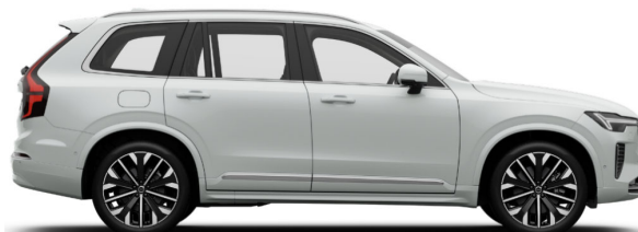
707 Crystal White