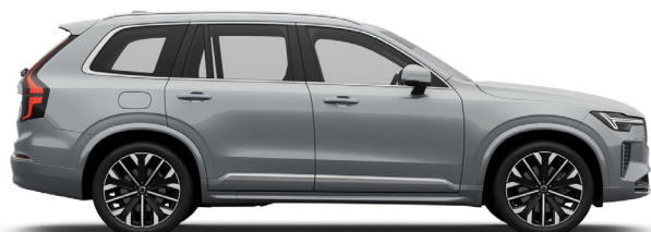
740 Vapour Grey