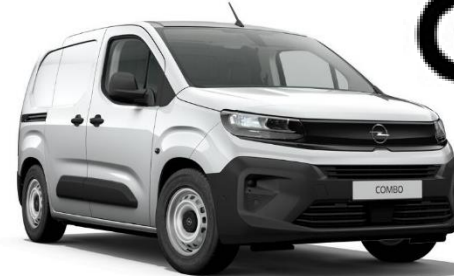
➤ COMBO CARGO Electric