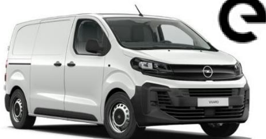
➤ NUOVO VIVARO Electric