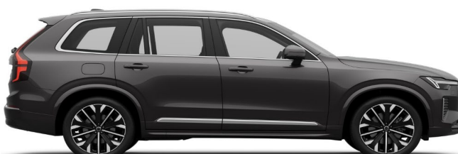
731 Platinum Grey