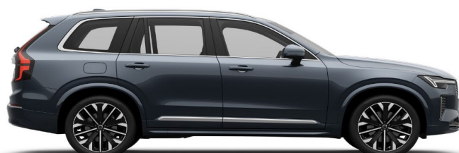
723 Denim Blue