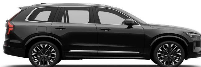
717 Onyx Black