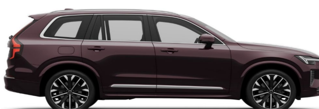
739 Mulberry Red