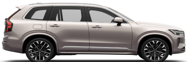
736 Bright Dusk