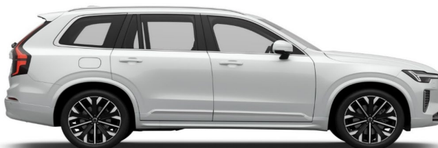
707 Crystal White