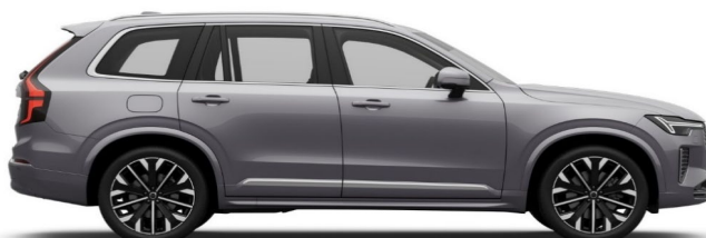
745 Aurora Silver