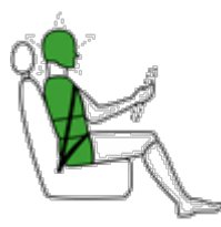
Conducente in impatto laterale