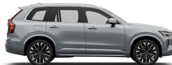
740 Vapour Grey