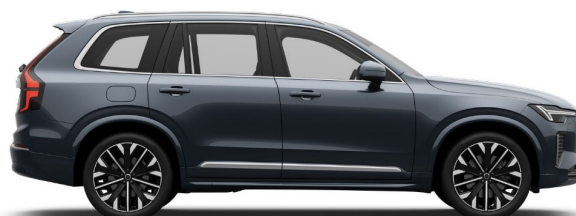
723 Denim Blue