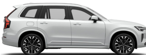
707 Crystal White