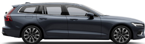
723 Denim Blue