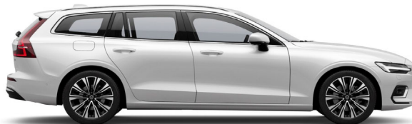
707 Crystal White