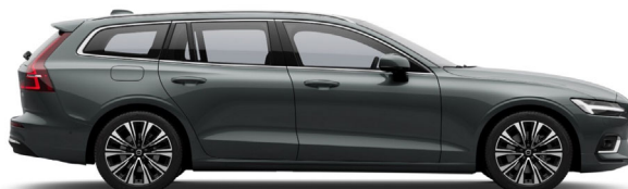
746 Forest Lake