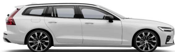
614 Ice White