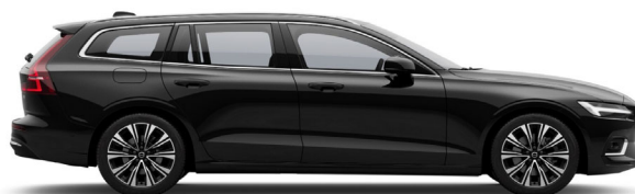
717 Onyx Black