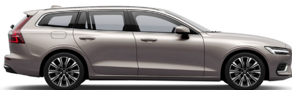
736 Bright Dusk