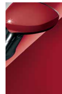
153 Rosso Accattivante