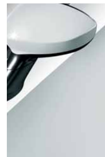
296 Bianco Divino