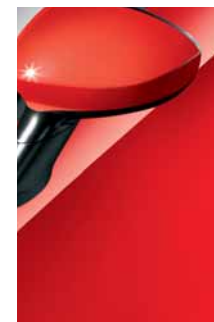
176 Rosso Passionale*