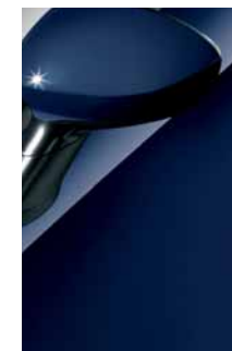
475 Blu Suggestivo