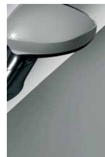
595 Grigio Impeccabile