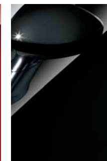
876 Nero Provocatore