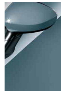
448 Azzurro Idealista