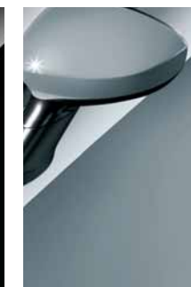
348 Grigio Intellettuale