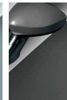
634 Grigio Pessimo Umore