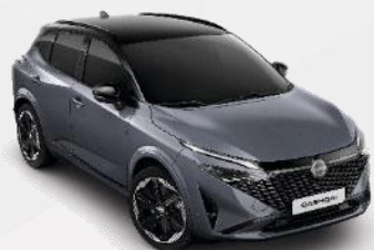
CERAMIC GREY /BLACK