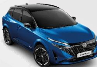
MAGNETIC BLUE /BLACK