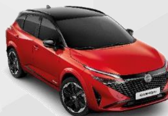
FUJI SUNSET RED /BLACK