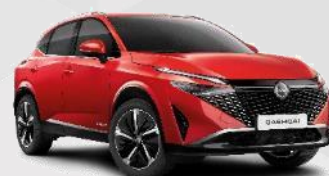
FUJI SUNSET RED