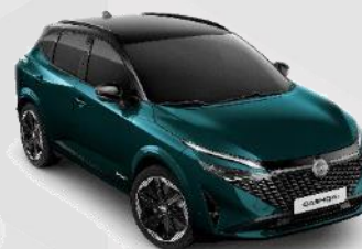
DEEP OCEAN /BLACK