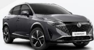
DARK METAL GREY