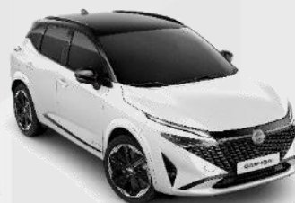
WHITE PEARL /BLACK