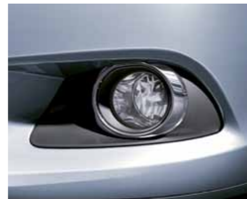
Cornici fari fendinebbia.