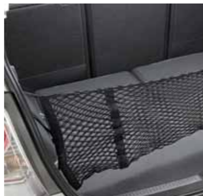
Rete di carico verticale.

Una pratica ed elegante protezione per la vernice della soglia della portiera.