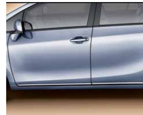
Rifiniture cromate laterali.