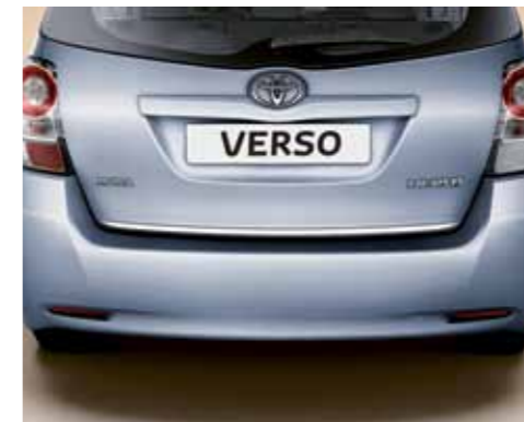
Rifinitura cromata posteriore.