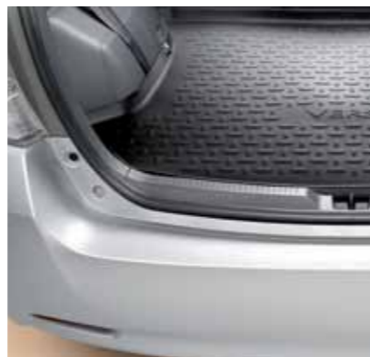
Protezione vano bagagli.