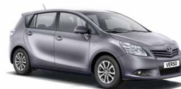
Greysh Blue Met