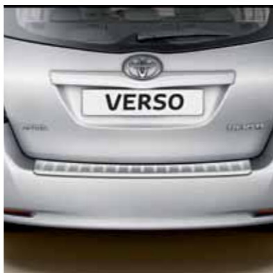
Protezione soglia paraurti posteriore.