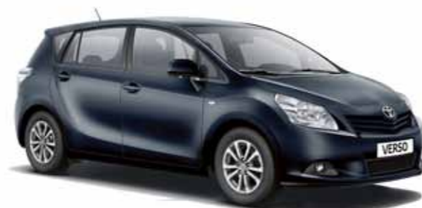
Deep Titanium Met