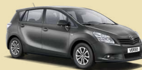
Dark Grey Met