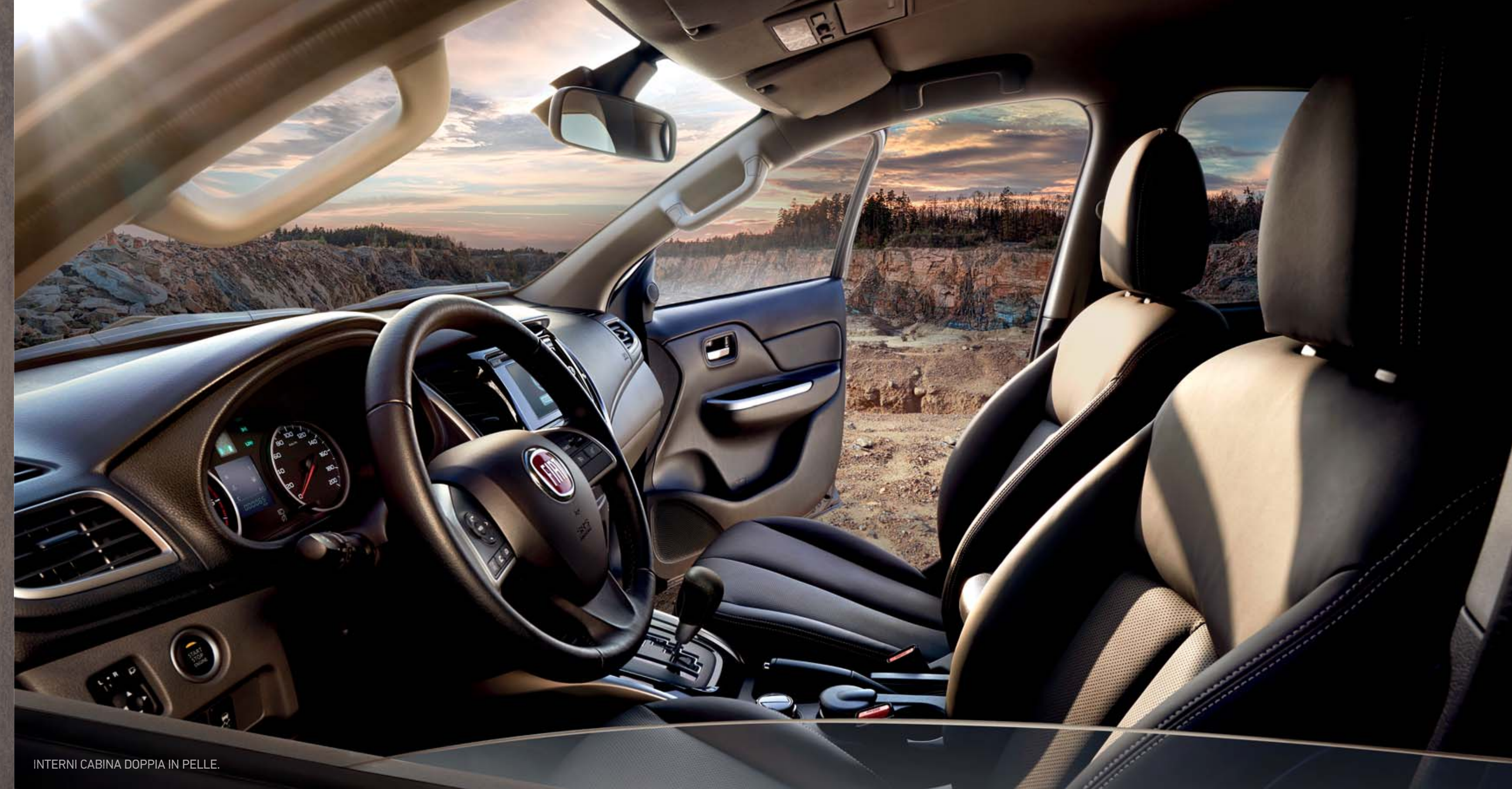
INTERNI CABINA DOPPIA IN PELLE.

Grazie ai suoi dispositivi tecnologici, come la RADIO MULTIFUNZIONE TOUCH SCREEN con NAVIGATORE , la connessione BLUETOOTH® e la RETROCAMERA per facilitare il parcheggio, il nuovo Fullback è il mezzo giusto per restare sempre connesso al tuo lavoro e alla tua vita.