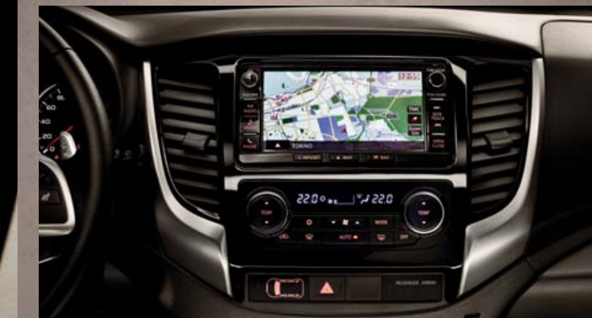
RADIO MULTIFUNZIONE TOUCH SCREEN CON NAVIGATORE.