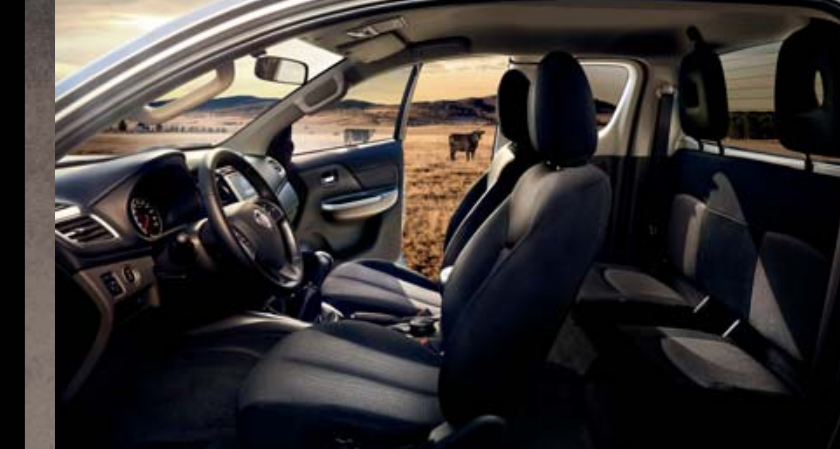
INTERNI CABINA ESTESA IN TESSUTO.