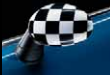
Calotte dei retrovisori esterni con Checkered Flag