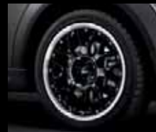
Cross Spoke Composite R90 nero, dimensioni 7J x 17 pollici