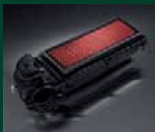
Kit Tuning: filtro aria sportivo