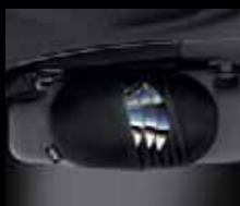
Custodia per CD/DVD