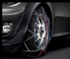
Catene da neve