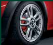
Double Spoke Composite R109, 7J x 18 pollici