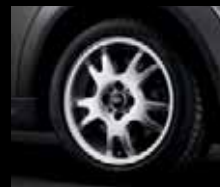
Double Spoke R87, dimensioni 6,5J x 16 pollici