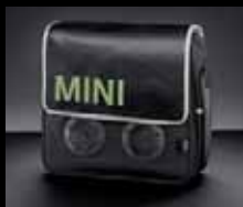
Borsa frigo MINI, a funzionamento elettrico

I modelli qui raffigurati sono in parte dotati di optional non compresi nell'equipaggiamento di serie. Con riserva di modifiche costruttive, di equipaggiamento e di contenuti. Salvo errori e omissioni. © BMW AG, Monaco di Baviera. La riproduzione, anche parziale, è possibile soltanto previa autorizzazione scritta della BMW Group Italia - Divisione MINI. Stampa Grafica (VR) 12/2011. MA11