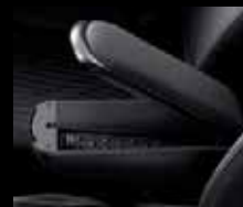
Bracciolo centrale con ampio vano portaoggetti