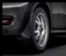
Paraspruzzi, per la parte anteriore e posteriore