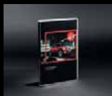
Aggiornamento Mappe stradali digitali