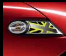
Side Scuttle gialli 1