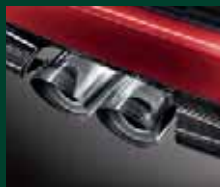
Kit Tuning: terminali di scarico sportivi cromati