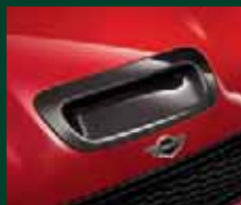
Presa d'aria in carbonio