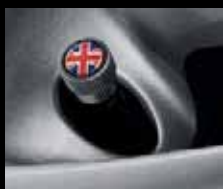
Tappi delle valvole Union Jack