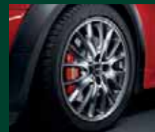
Cross Spoke R114 in grigio titanio (pneumatico invernale), 5,5J x 17 pollici