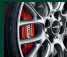
Freni sportivi, con dischi forati e scanalati