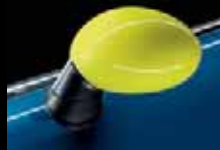
Calotte dei retrovisori esterni gialle 1