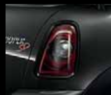
Gruppi ottici posteriori Black Line