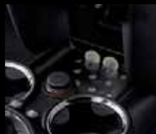
Vano porta-oggetti nella consolle centrale