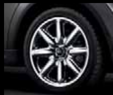
S-Spoke R85 cromato, dimensioni 7J x 17 pollici