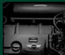
Kit Tuning: mappatura sportiva della centralina 1