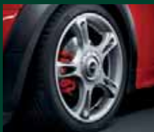
Star Spoke R95, 7J x 18 pollici