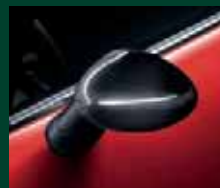
Calotte dei retrovisori esterni in carbonio