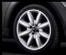
S-Spoke R85 argento, dimensioni 7J x 17 pollici