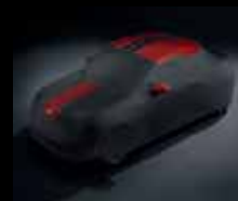
Telo di protezione