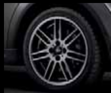
Double Spoke R99 grigio metallizzato, dimensioni 7J x 17 pollici