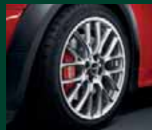
Cross Spoke Challenge R112, 7J x 17 pollici