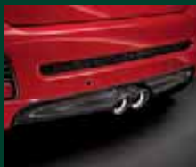
Diffusore in carbonio