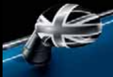
Calotte dei retrovisori esterni con Black Jack