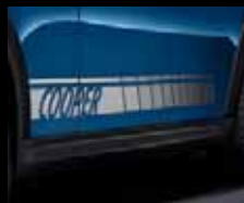
Side Stripes Cooper/Cooper S