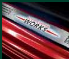
Listelli battitacco con logo (con o senza illuminazione)

I modelli qui raffigurati sono in parte dotati di optional non compresi nell'equipaggiamento di serie. Con riserva di modifiche costruttive, di equipaggiamento e di contenuti. Salvo errori e omissioni. © BMW AG, Monaco di Baviera. La riproduzione, anche parziale, è possibile soltanto previa autorizzazione scritta della BMW Group Italia - Divisione MINI. Stampa Grafica (VR) 12/2011. MJ07