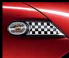
Side Scuttle con Checkered Flag