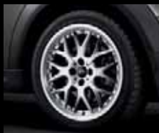
Cross Spoke Composite R90 argento, dimensioni 7J x 17 pollici