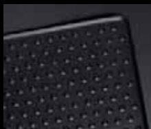
Tappetini in gomma