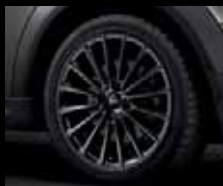
Multi Spoke R108 nero opaco, dimensioni 7J x 17 pollici