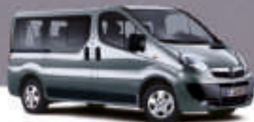
▲ Steel Grey 3