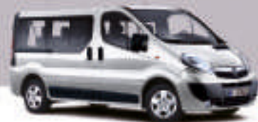
▲ Star Silver 3