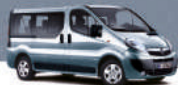
▲ Winterwind 4