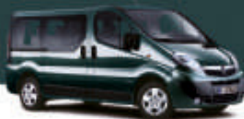
▲ Ocean Green 3