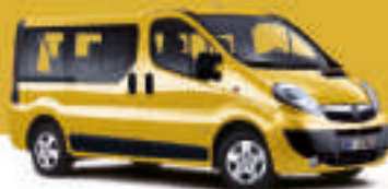
▲ Corn Yellow 1