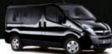
▲ Midnight Black 4