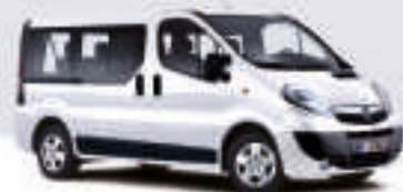
▲ Casablanca White 1