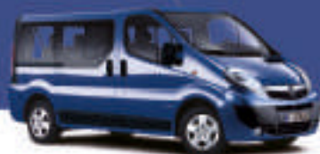
▲ Ink Blue 1