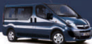
▲ Panorama Blue 4