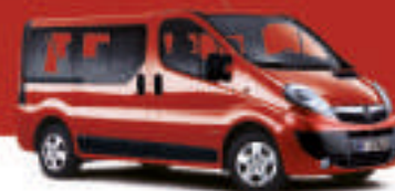
▲ Magma Red 2