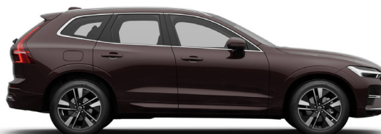
739 Mulberry Red