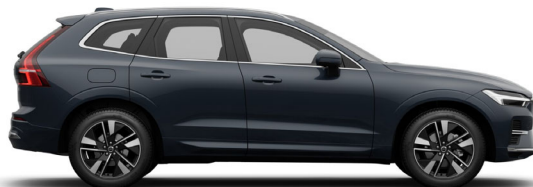
723 Denim Blue