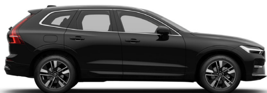
717 Onyx Black