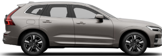
736 Bright Dusk