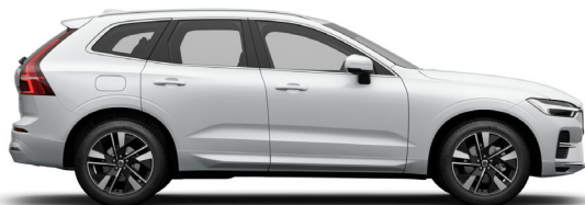
707 Crystal White