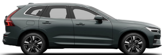
746 Forest Lake