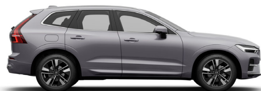
745 Aurora Silver