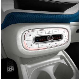
I01 | climatizzatore automatico