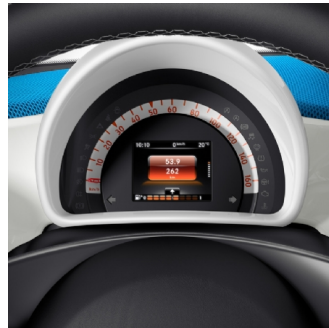
K36 | strumentazione a colori