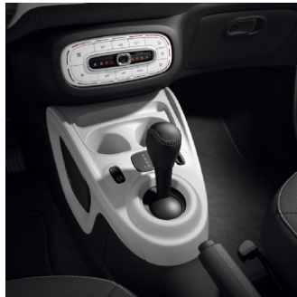
429 | cambio automatico DCT