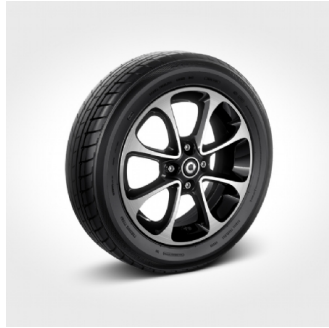
R86 | cerchi 15" in lega