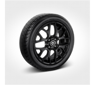
R95 | cerchi 16" in lega