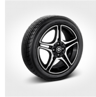
R91 | cerchi 16" in lega