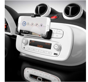
C67 | smartphone connection