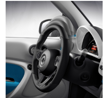
P74 | comfort pack