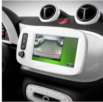
218 | telecamera posteriore