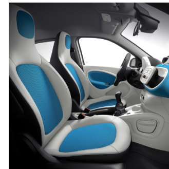
04U | interni white & blue