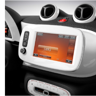
C04 | radio DAB