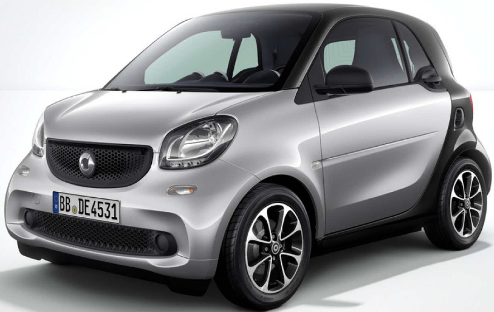
smart fortwo black passion