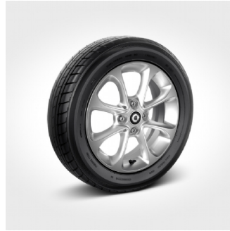
R88 | cerchi 15" in lega