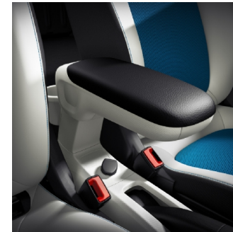
J59 | bracciolo