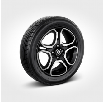
R87 | cerchi 15" in lega