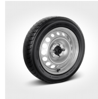
R82 | cerchi 15" in acciaio