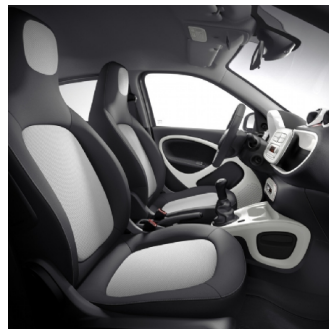
03U | interni black & white