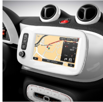
P26 | cool & media