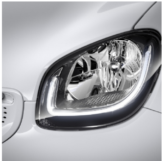
P25 | LED & sensor