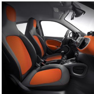
02U | interni black & orange