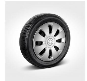
R83 | cerchi 15" in acciaio