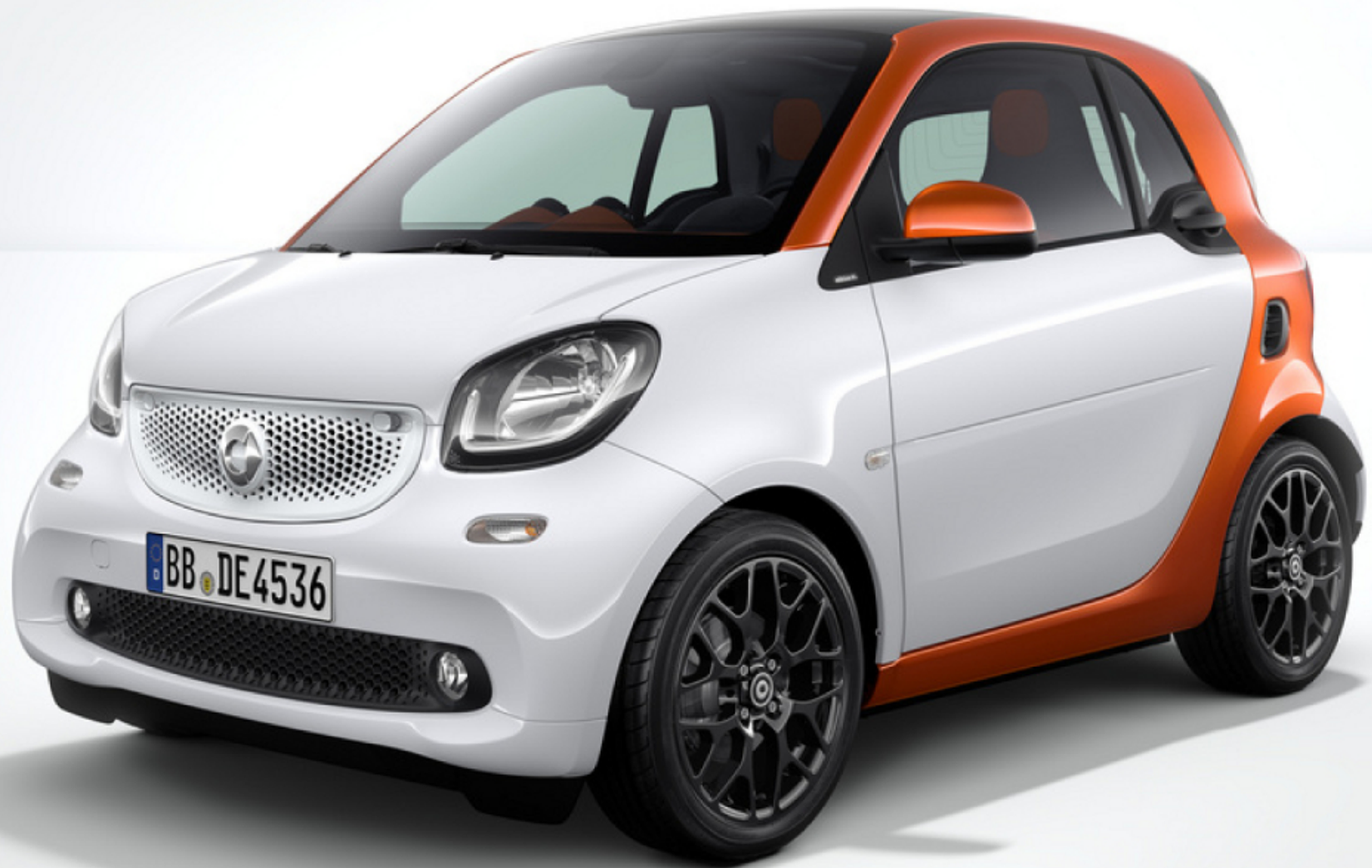
smart fortwo sport edition #1