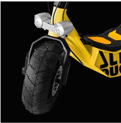
Doppio faro anteriore a LED