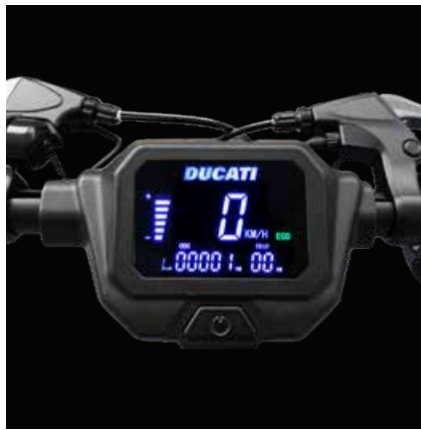
Ampio display LCD da 3.8"