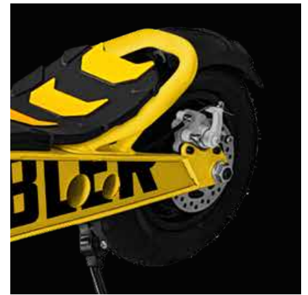
Ruote Tubeless 110/50-6.5"