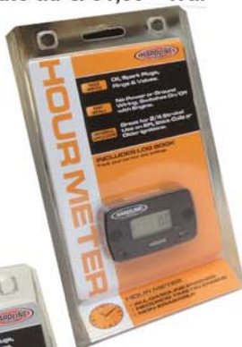
HR 8063/2 CONTA ORE

Disponibile anche la versione HR8063/2 che ha le stesse funzioni della versione HR8061/2 meno il tacchimetro. Venduto ad €. 31,80 + iva.