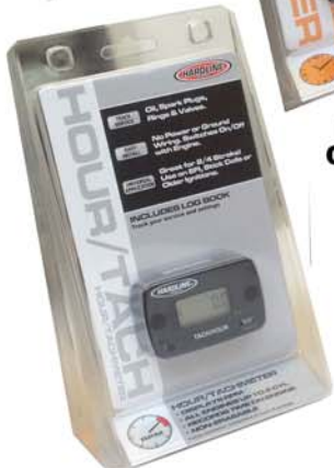
HR 8061/2 CONTA ORE + TACHIMETRO