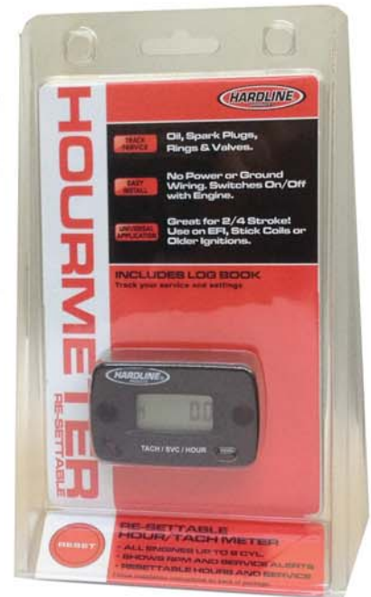
HR8067 CONTA ORE RESETTABILE