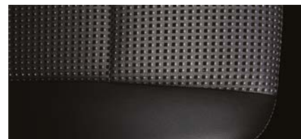
LT - JET BLACK CLOTH + PU