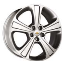
19" ALLOY WHEEL