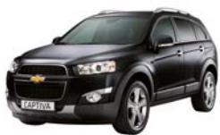
Carbon flash (metallizzato)