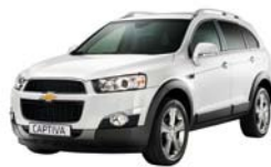
White pearl (metallizzato)