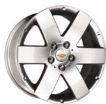
17" ALLOY WHEEL