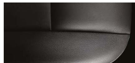
LTZ - PELLE JET BLACK