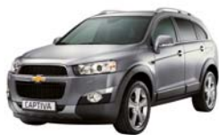
Placid grey (metallizzato)