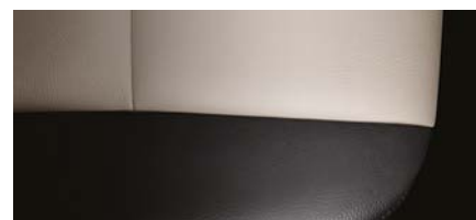
LTZ - PELLE JET BLACK / LIGHT TITANIUM