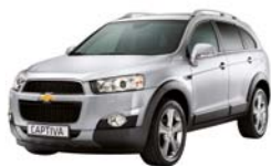
Ice silver (metallizzato)