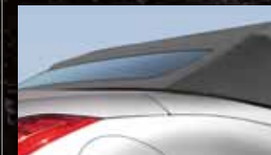
Gamma capote morbide Capote in Nero disponibile con allestimenti in tessuto nero, pelle nera o bordeaux