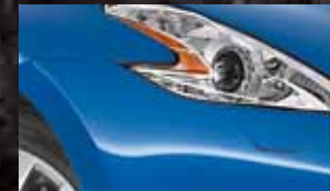
BLUE LE MANS RAE / (P)