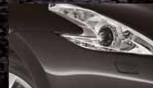
DIAMOND BLACK G41 / (M)