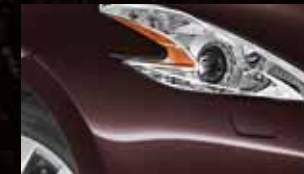
BLACK ROSE* NAG / P