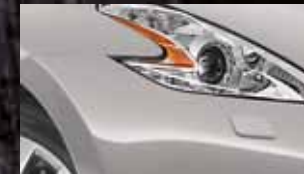
BRILLIANT SILVER K23 / (M)