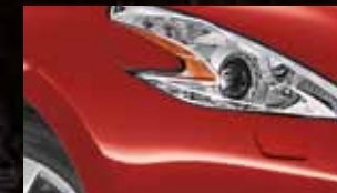
VIBRANT RED A54 / (S)