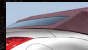
Capote in Bordeaux disponibile con allestimenti in tessuto nero, pelle nera o bordeaux