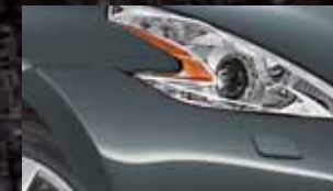
GUN METALLIC KAD / (M)