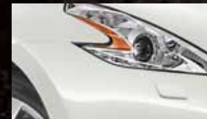
BRILLIANT WHITE QAB / (P)