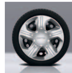
Copriruota Lyric (di serie)