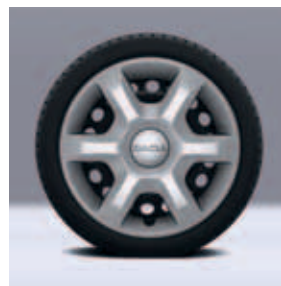
Copriruota Aracaju (di serie)