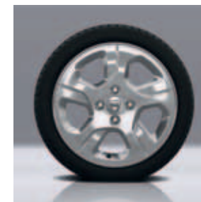
Cerchi in lega 15" Empreinte (in opzione)