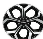
Cerchi in lega da 17" 225/45 R17