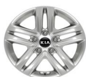
Cerchi in lega da 16" 205/55 R16