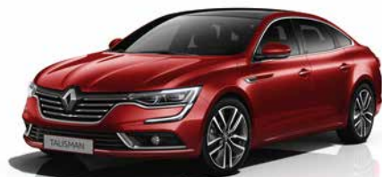
Rosso Carminio (VM)