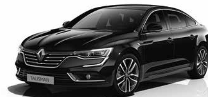
Nero Étoilé (VM)