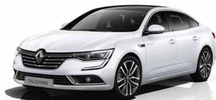
Bianco Ghiaccio (VO)