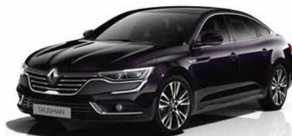
Nero Ametista (VM)*