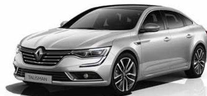
Grigio Platino (VM)