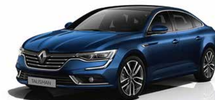
Blu Cosmo (VM)