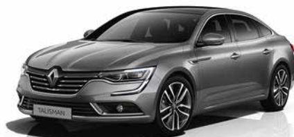
Grigio Cassiopea (VM)