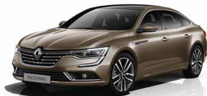
Marron Glacé (VM)