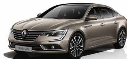
Beige Duna (VM)