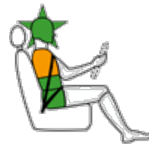
Conducente in impatto laterale