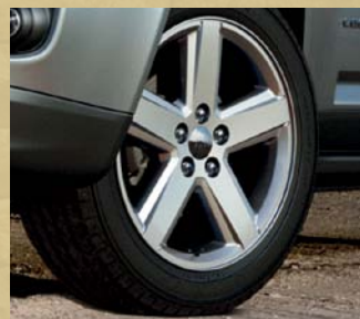
Cerchi in lega da 18" x 7 (di serie su Limited)