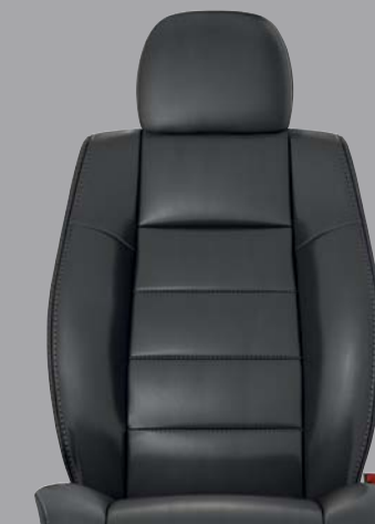
LIMITED Rivestimenti dei sedili in pelle Dark Slate Gray con cuciture in contrasto