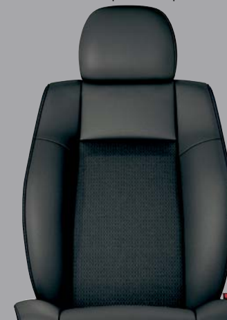
SPORT Rivestimenti dei sedili in tessuto Dark Slate Gray

Cambio automatico non disponibile per l'Italia