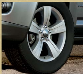
Cerchi in lega da 17" x 6,5 (di serie su Sport)