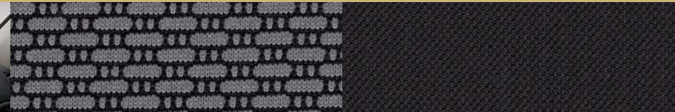
Rivestimenti dei sedili in tessuto Dark Slate Gray