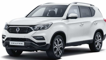
Grand White (WAA) - P