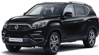
Space Black (LAK) - M