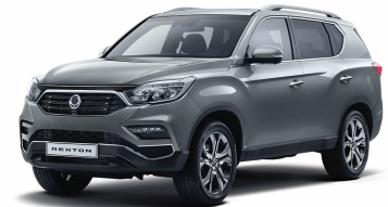
Elemental grey (ACY) - M