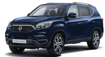
Atlantic Blue (BAU) - M