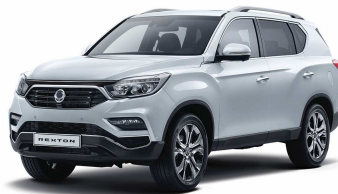
Fine Silver (SAF) - M