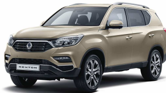
Sabia Beige (EBE) - M