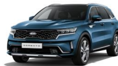
Mineral Blue (M4B)