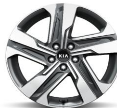
Cerchio in lega da 19"