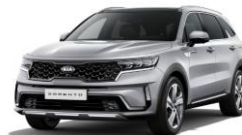
Silky Silver (4SS)