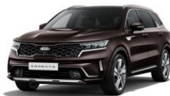
Essence Brown (BE2)