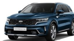
Gravity Blue (B4U)