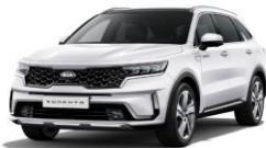
Clear White (UD)