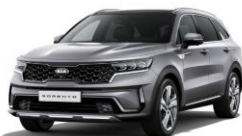
Steel Grey (KLG)