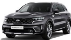
Platinum Graphite (ABT)