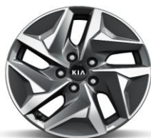
Cerchio in lega da 17" (Solo HEV)