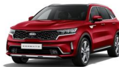
Runway Red (CR5)