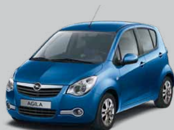
▲ Cornflower Blue