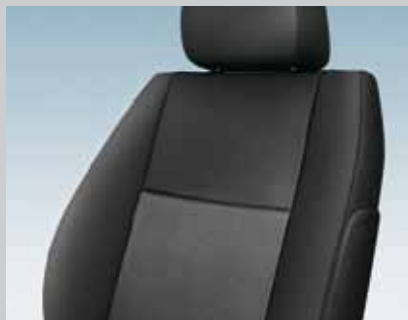
▶ Caro/Elba Antracite

Interni glamour e colori accattivanti per una nuova definizione di stile urbano.