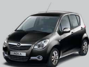
▲ Cosmic Black