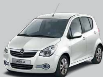
▲ Sugar White