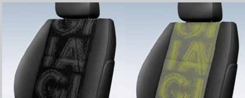
▼ Melt/Elba Verde/Antracite