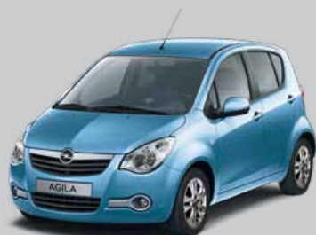
▲ Moroccan Blue