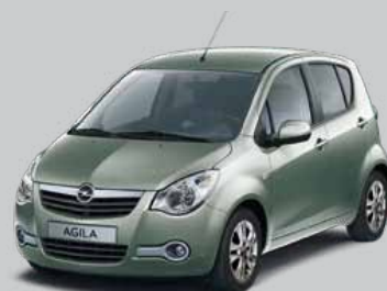
▲ Oregano Green