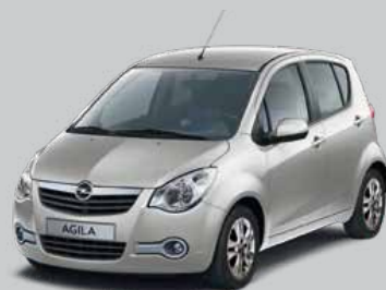
▲ Steel Silver