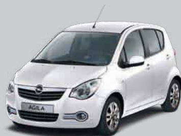
▲ Galactic White