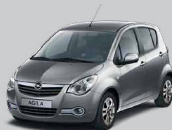
▲ Meteorite Grey