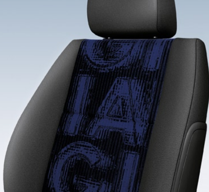
▲ Melt/Elba Azzurro/Antracite