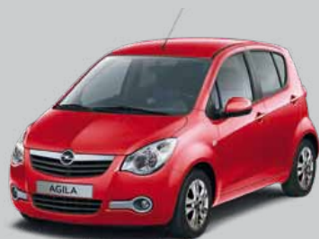
▲ Blaze Red