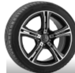
18 CERCHIO A 5 RAZZE Cerchio a 5 razze 8 J x 18 ET 45 - 235/40 R18 A207 401 1602 7X23

Superficie: argento titanio, tornita a specchio