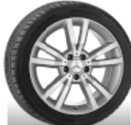
18 SHIKRIO Cerchio a 5 doppie razze 8 J x 18 ET 45 - 235/40 R18 A207 401 1102 7X07

Superficie: argento titanio, tornita a specchio