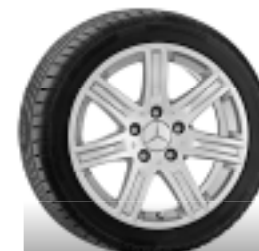
16 CERCHIO A 7 RAZZE 7 J x 16 ET 38 - 205/55 R16 A212 401 1702 9709