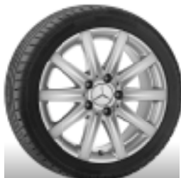
16 LUGO Cerchio a 10 razze 7,5 J x 16 ET 45 - 215/55 R16 A207 401 0802 9709