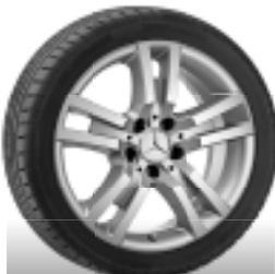
17 KHOTRIMA Cerchio a 5 doppie razze 7,5 J x 17 ET 45 - 235/45 R17 A207 401 0902 7X07

Superficie: argento titanio, tornita a specchio