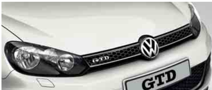
Bianco Vernice monostrato B4