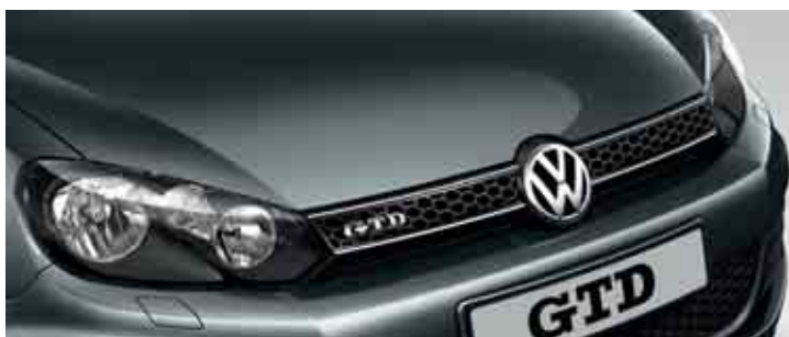
Grigio Grafite Vernice metallizzata 1K