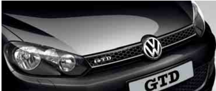
Nero Vernice monostrato A1