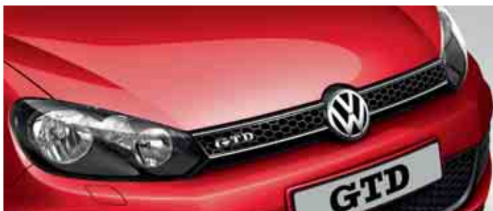
Rosso Tornado Vernice monostrato G2