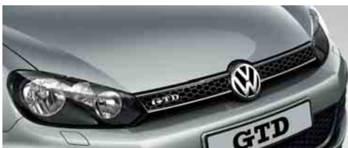
Argento Riflesso Vernice metallizzata 8E