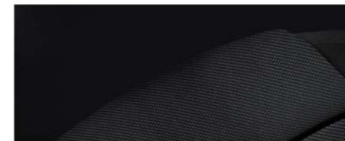
LT/LTZ - Interni Jet Black/Jet Black