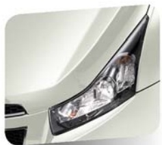
Olympic White (solid)