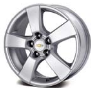
LT: Cerchi in lega da 16"