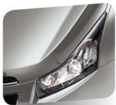
Ice Silver (metallic)