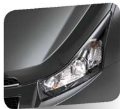
Pewter Grey (metallic)