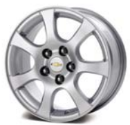
LTZ: Cerchi in lega da 17"