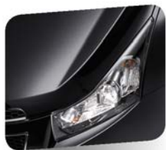
Carbon Flash Black (metallic)