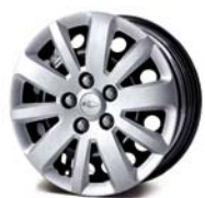
LS: Cerchi in acciaio con copriruota da 16"