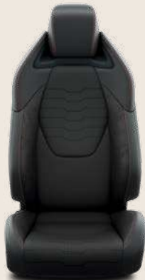
Pelle parziale nera, cuciture rosse e finiture nere. Di serie su allestimento Lounge.