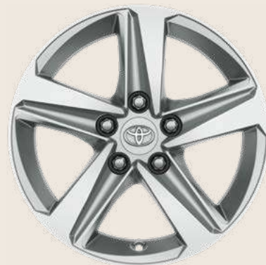
Cerchi in lega da 16" Silver con pneumatici Yokohama BluEarth Winter 205/55 R16