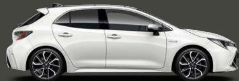
040 Super White