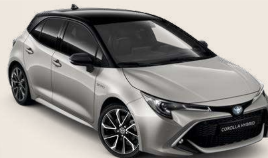
2RD Precious Silver § & Black §