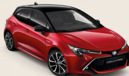
2SZ Emotional Red § & Black §