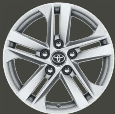
Cerchi in lega da 16" di serie su allestimento Active