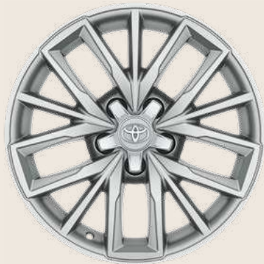
Cerchi in lega da 17" Silver con pneumatici Yokohama BluEarth Winter 225/45 R17