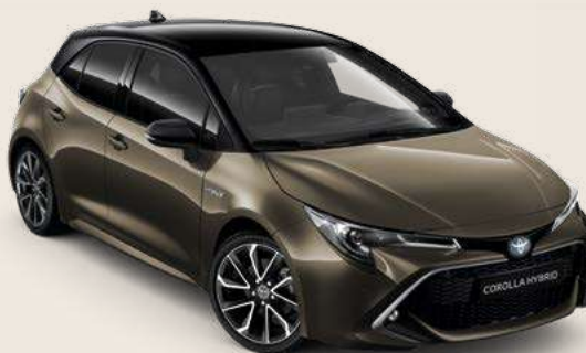
2RF Oxide Bronze Met § & Black §