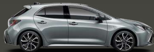
1H5 London Grey Met 5