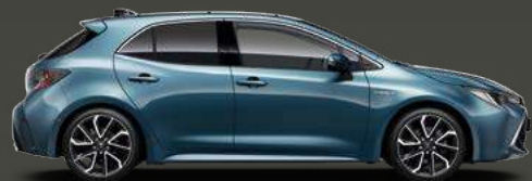
8U6 Frozen Blue Met 5