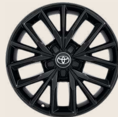
Cerchi in lega da 17" Nero con pneumatici Yokohama BluEarth Winter 225/45 R17