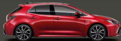
3U5 Emotional Red 5