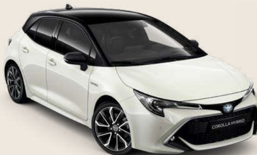
2KR Pearl White* & Black §