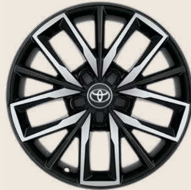
Cerchi in lega da 17" Nero Lavorato con pneumatici Yokohama BluEarth Winter 225/45 R17