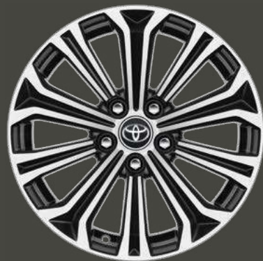
Cerchi in lega da 17" con inserti Black di serie su allestimento Style