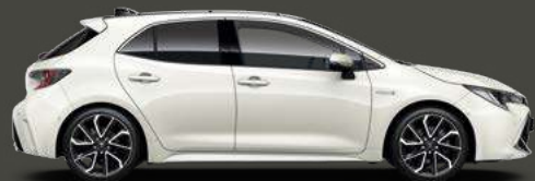
070 Pearl White*