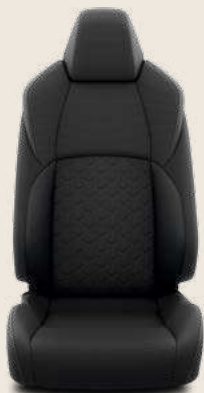
Tessuto nero/grigio imbottito, cuciture grigie. Di serie su allestimento Active e Style.