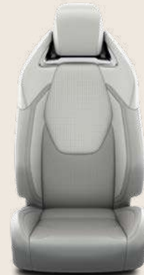
Pelle parziale grigio chiaro e finiture satin cromate. A richiesta su allestimento Lounge.