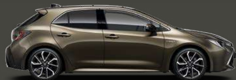
6X1 Oxide Bronze Met §