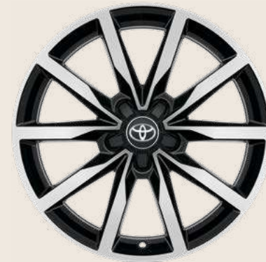
Cerchi in lega da 18" Nero Lucido Lavorato con pneumatici Yokohama BluEarth Winter 225/40 R18