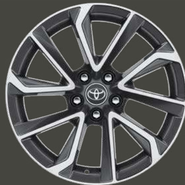
Cerchi in lega da 18" con inserti Black di serie su allestimento Lounge