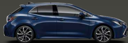
8Q4 Dark Blue