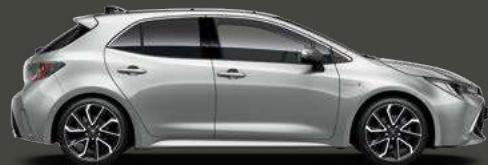
1F7 Silver Met §