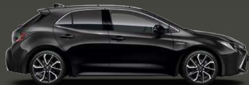
209 Black Met §