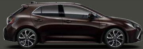
4W9 Phantom Brown Met 5