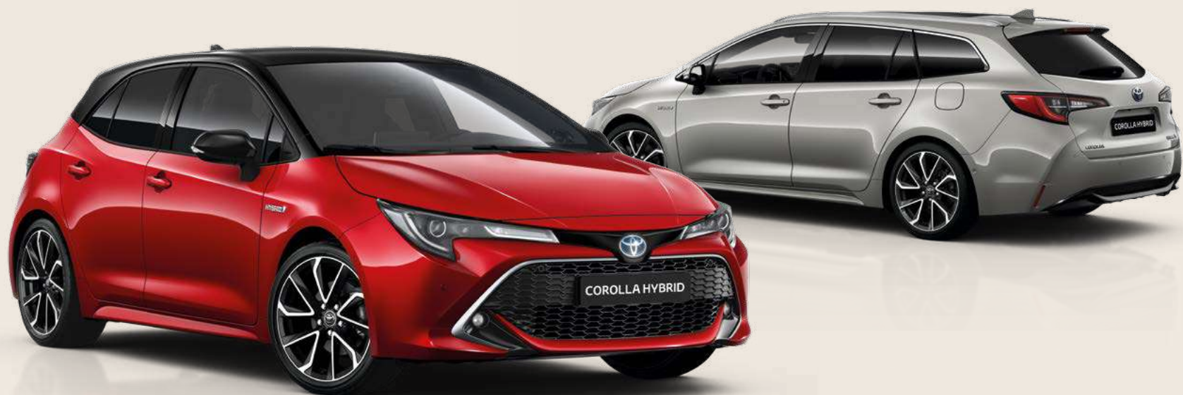
Allestimento raffigurato: Lounge.