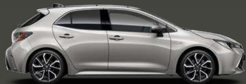
1J6 Precious Silver 5