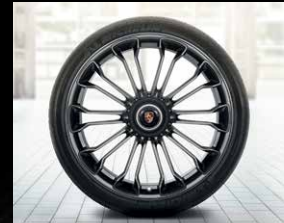
Cerchi 918 Spyder verniciati in colore platino (lucido)