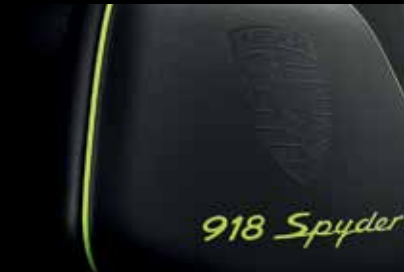
Allestimento in pelle nero onice-acid green