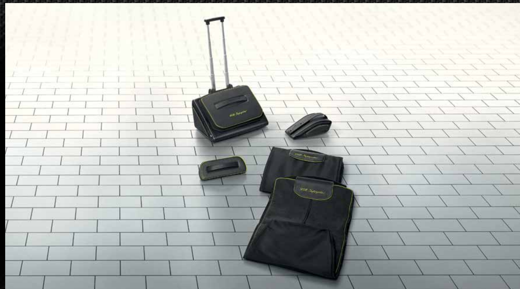
Set di bagagli 918 Spyder