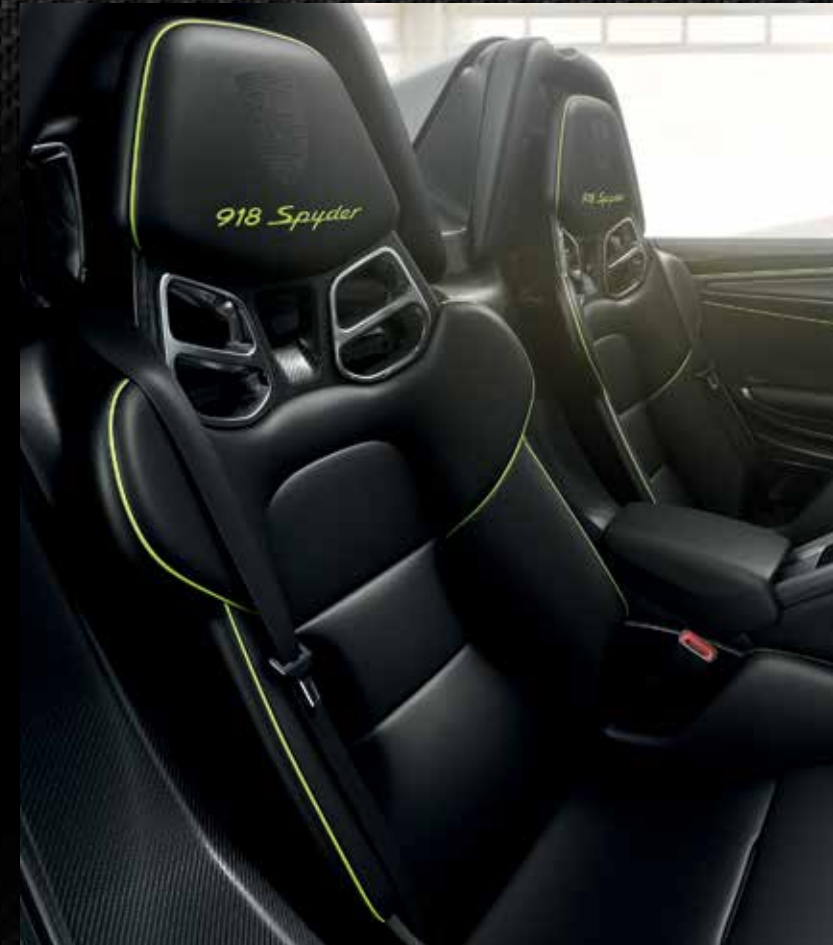
Sedili a guscio in struttura leggera