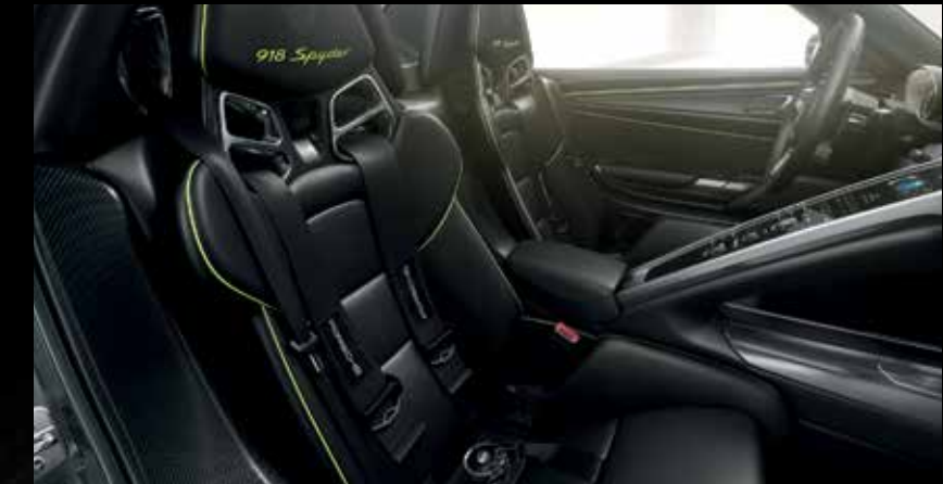
Cinture di sicurezza a 6 punti

● Equipaggiamento di serie ○ Equipaggiamento opzionale ■ A scelta, senza sovrapprezzo