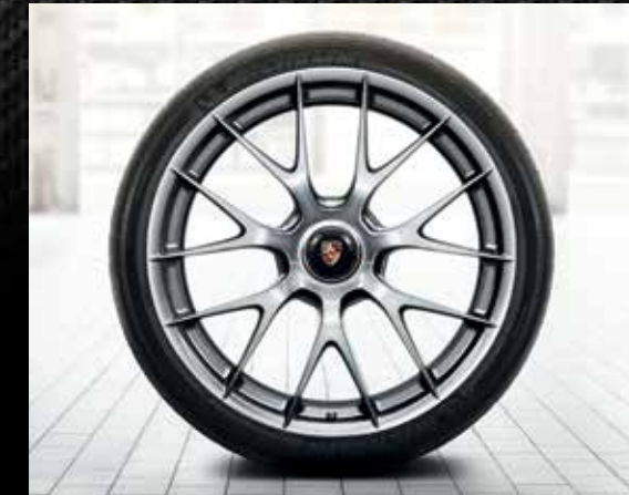
Cerchi in magnesio 918 Spyder (20/21")