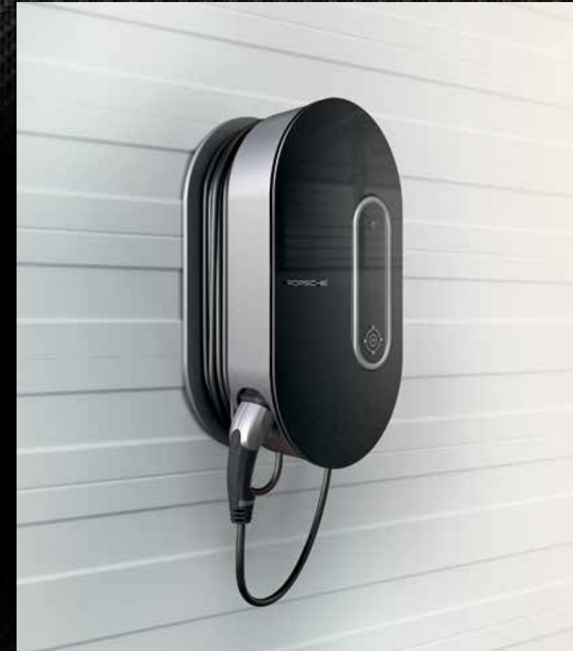
Dock di ricarica con caricabatteria universale (AC) Porsche agganciato