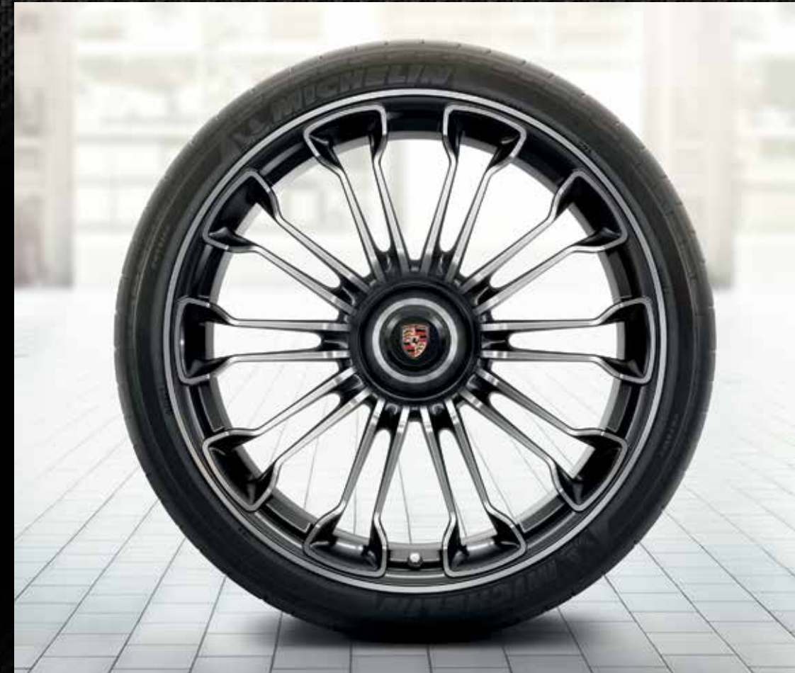
Cerchi 918 Spyder (20/21")