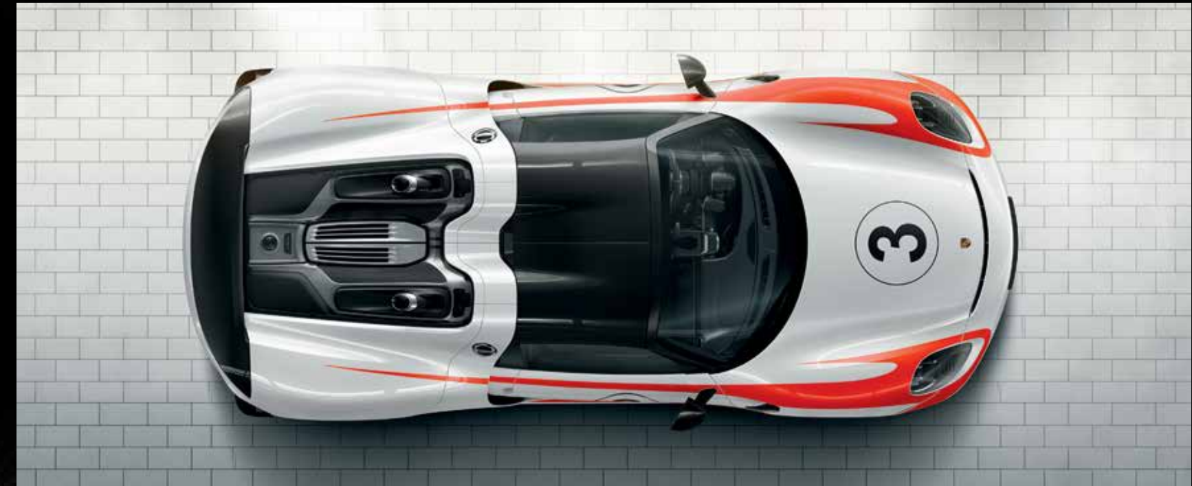
918 Spyder con pacchetto Weissach

● Equipaggiamento di serie ○ Equipaggiamento opzionale ■ A scelta, senza sovrapprezzo