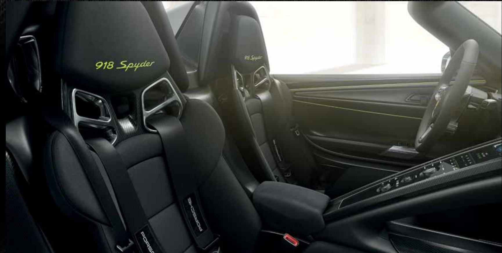
Allestimento in pelle «pacchetto Weissach» con sedili a guscio in struttura leggera e fascia centrale dei sedili in tessuto a bassa infiammabilità

• Equipaggiamento di serie ○ Equipaggiamento opzionale ■ A scelta, senza sovrapprezzo