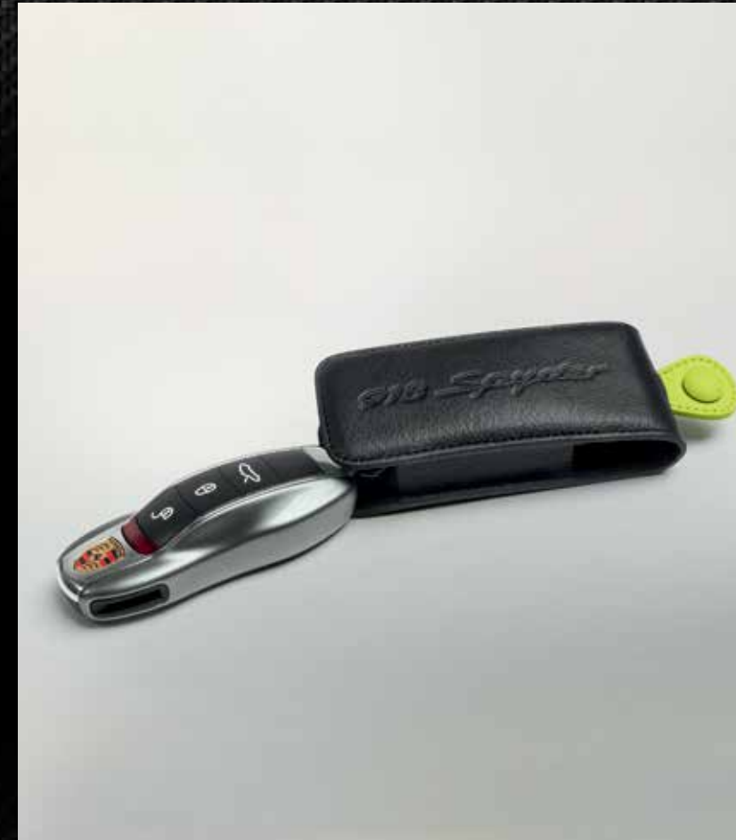
Chiave della vettura verniciata, con astuccio portachiavi in pelle