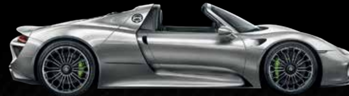
Argento Liquid metal