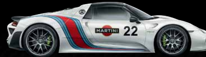
Rivestimento completo con pellicola decorativa nel design MARTINI RACING 1)