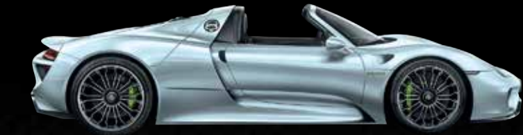
Blu cromo Liquid metal