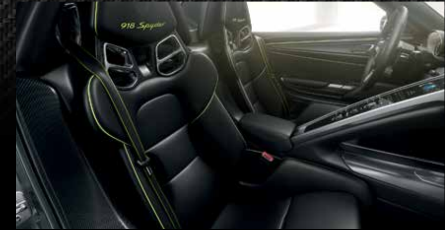
Cinture di sicurezza con strisce sportive