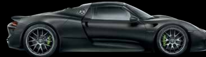
Rivestimento completo con pellicola in colore nero (opaco)