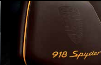
Allestimento in pelle Authentic marrone moka-arancio