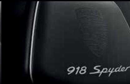
Allestimento in pelle nero onice-argento