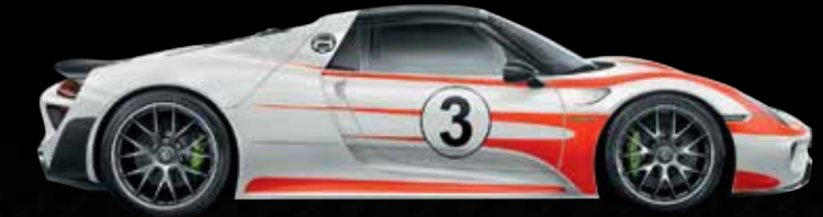
Rivestimento completo con pellicola decorativa nel design Salzburg Racing

● Equipaggiamento di serie ○ Equipaggiamento opzionale ■ A scelta, senza sovrapprezzo