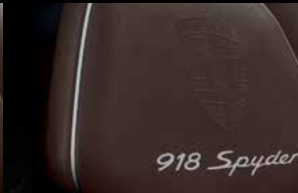
Allestimento in pelle Authentic marrone moka-argento

• Equipaggiamento di serie ○ Equipaggiamento opzionale ■ A scelta, senza sovrapprezzo