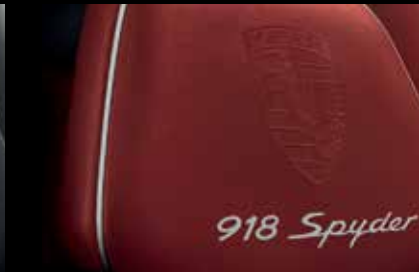
Allestimento in pelle rosso granata-argento