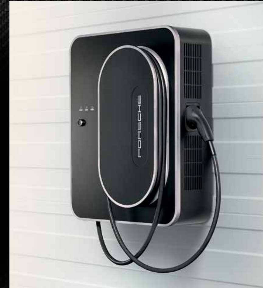
Stazione di ricarica rapida (DC) Porsche