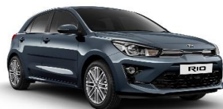
Smoke Blue (EU3)