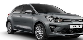
Perennial Grey (PRG)