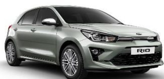
Urban Green (URG)