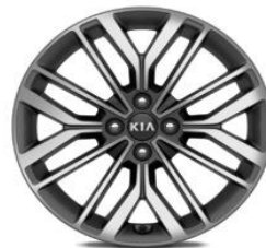
Cerchio in lega da 17" 205 45 R17