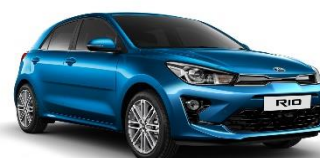
Sporty Blue (SPB)