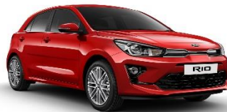
Signal Red (BEG)