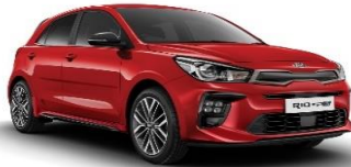
Signal Red (BEG)