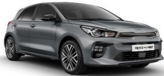
Perennial Grey (PRG)