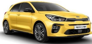
Most Yellow (MYW)