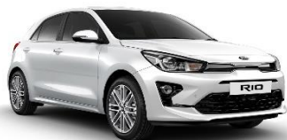
Clear White (UD)