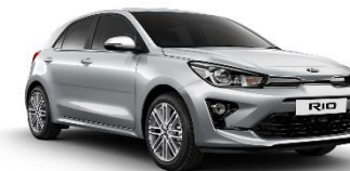
Silky Silver (4SS)