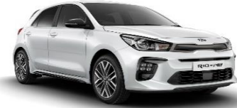
Clear White (UD)