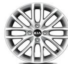
Cerchio in lega da 15" 185 65 R15