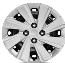
Cerchio in acciaio da 15" 185 65 R15