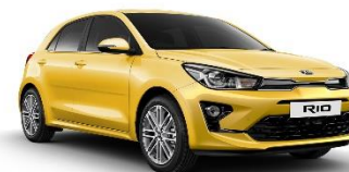
Most Yellow (MYW)