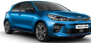
Sporty Blue (SPB)