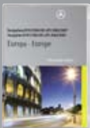
DVD di navigazione Europa per COMAND APS