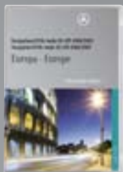
DVD di navigazione Europa per Audio 50 APS

I dati per i sistemi di navigazione Mercedes-Benz vengono continuamente aggiornati. Vi invitiamo a rivolgervi al vostro Mercedes-Benz Service per trovare le versioni più aggiornate.