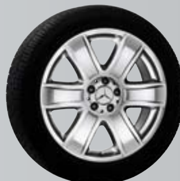
Alrai | Cerchio a 6 razze

Cerchio incenio Superficie: argento Sterling Dimensioni: 8 J x 19 ET 60 | Pneum.: 255/50 R19 B6 647 4217