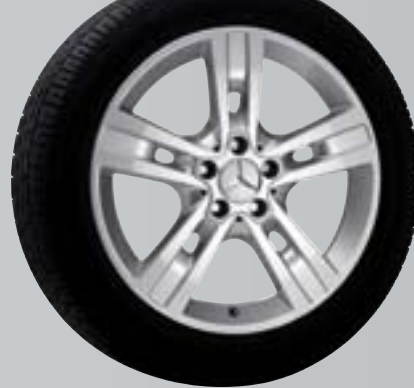
Gyas | Cerchio a 5 razze

Sfogliate le prossime pagine per scoprire altre emozioni.