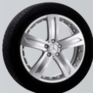
Klemola | Cerchio a 5 razze

Cerchio incenio Superficie: argento Sterling Dimensioni: 8,5 J x 20 ET 60 | Pneum.: 265/45 R20 B6 647 4212; L'utilizzo di catene da neve non è possibile.