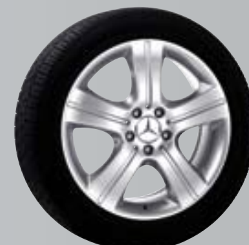
Mintaka | Cerchio a 5 razze

Cerchio incenio Superficie: argento Sterling Dimensioni: 8,5 J x 19 ET 60 | Pneum.: 255/50 R19 B6 647 4367 A richiesta per le ruote posteriori: Dimensioni: 9,5 J x 19 ET 56 | Pneum.: 285/45 R19 B6 647 4368; L'utilizzo di catene da neve non è possibile.