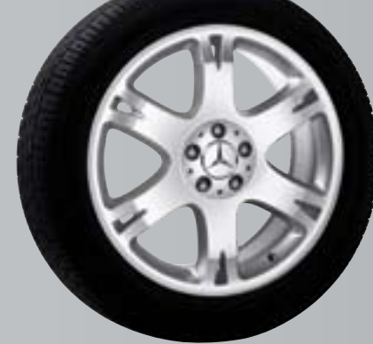
Rukbat | Cerchio a 6 razze

Cerchio incenio Superficie: argento Sterling Dimensioni: 8 J x 18 ET 60 | Pneum.: 255/55 R18 B6 647 4216