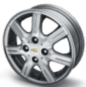
Cerchi in lega da 14" a 7 razze*