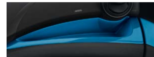
Inseri "Blue Gloss"