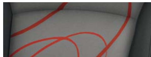
Spark LT: Tessuto Woven Red con colori esterni Super Red e Carbon Flash Black