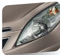
Coconut Champagne (metallizzato)