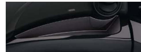
Inseri "Black Gloss"