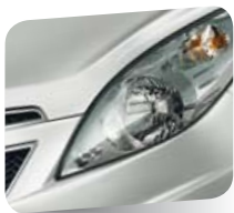
Ice Silver (metallizzato)