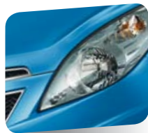
Moroccan Blue (metallizzato)