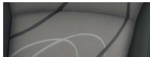
Spark LT: Tessuto Woven Silver con colori esterni Green Cocktail, Olympic White E Coconut Champagne