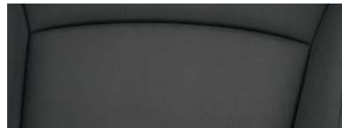
Spark, Spark+: Tessuto Knit