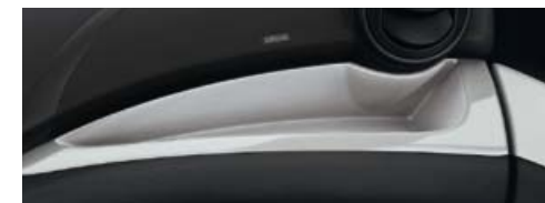
Inseri "Silver Gloss"