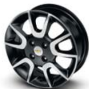
Cerchi in lega da 15" a 5 razze doppie *

* Accessori non disponibili di serie ma a richiesta presso i concessionari Chevrolet