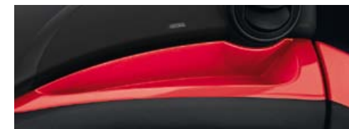
Inseri "Red Gloss"