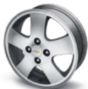
Cerchi in lega da 15" a 5 razze