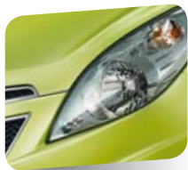
Cocktail Green (metallizzato)