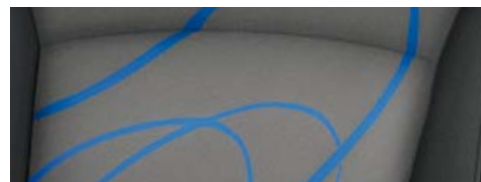
Spark LT: Tessuto Woven Blue con colori esterni Moroccan Blue e Switchblade Silver