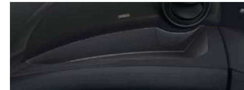
Inseri "Grain Look"