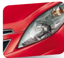
Super Red (pastello)