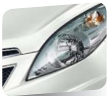
Olympic White (pastello)