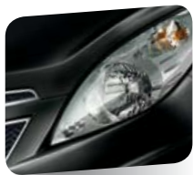
Carbon Flash Black (metallizzato)