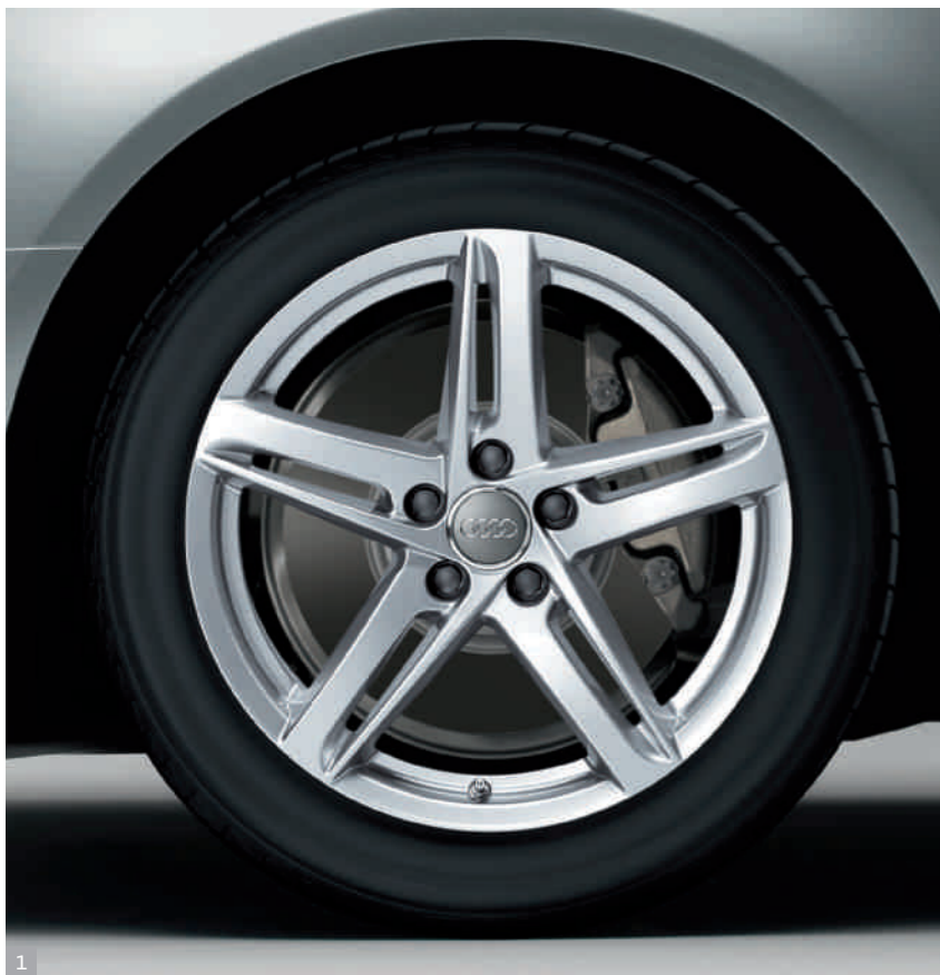
1 Cerchi in lega di alluminio a 5 razze a rotore Presentano un look particolarmente dinamico e sono disponibili nelle dimensioni 8 J x 18 per pneumatici 245/40 R 18.