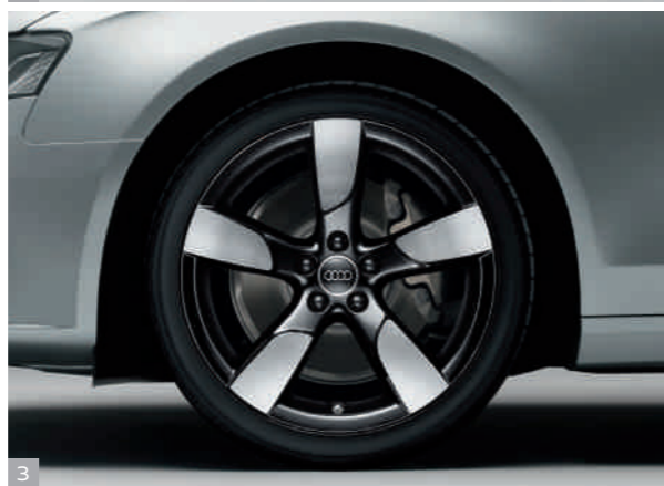
3 Cerchi in lega di alluminio a 5 razze cave, neri Disponibili nelle dimensioni 8,5 J x 19 per pneumatici 255/35 R 19.