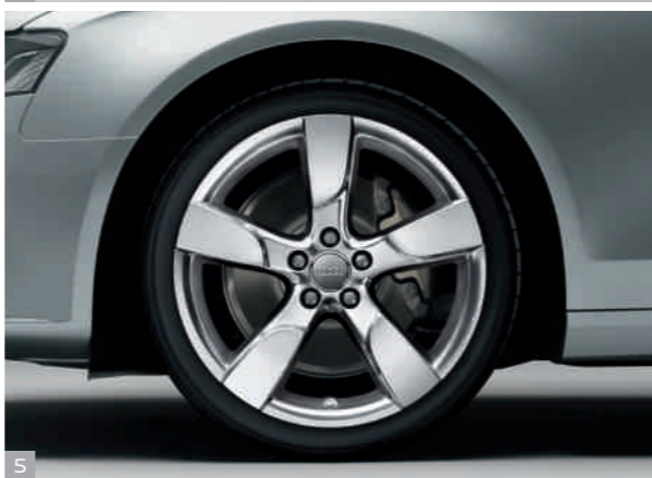
5 Cerchi in lega di alluminio a 5 razze cave, lucidi a specchio Questi cerchi con razze cave arricchiscono la vostra vettura di un elemento particolarmente brillante. Disponibili nelle dimensioni 8,5 J x 19 per pneumatici 255/35 R 19.