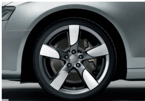
2 Cerchi in lega di alluminio a 5 razze cave, antracite Coniugano design raffinato e tecnica innovativa per offrire una sicurezza ancora maggiore. Disponibili nelle dimensioni 8,5 J x 19 per pneumatici 255/35 R 19.