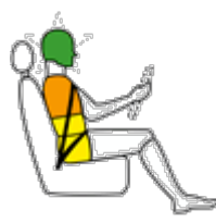
Conducente in impatto laterale