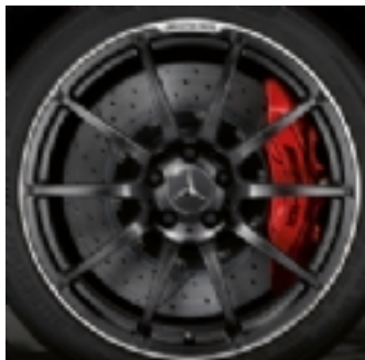
Cerchi da 19/20 (767)