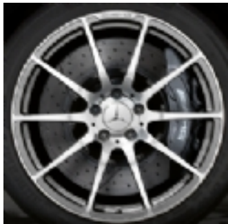
Cerchi da 19/20 (766)