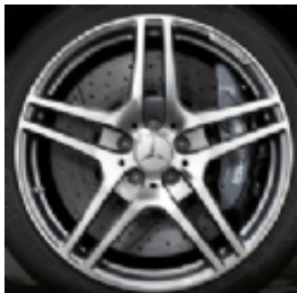
Cerchi da 19/20 (764)