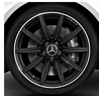
Cerchi AMG 19" (752)