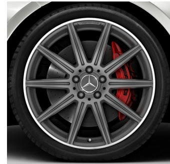
Cerchi AMG 19" (662)