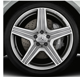
Cerchi AMG 19" (797)