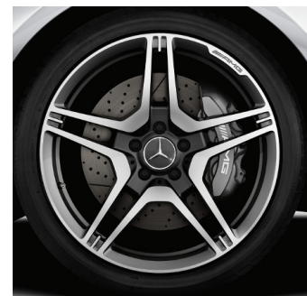
Cerchi AMG 19" (793)