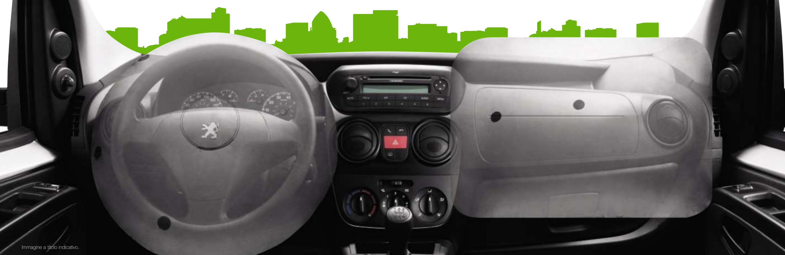
Immagine a titolo indicativo.