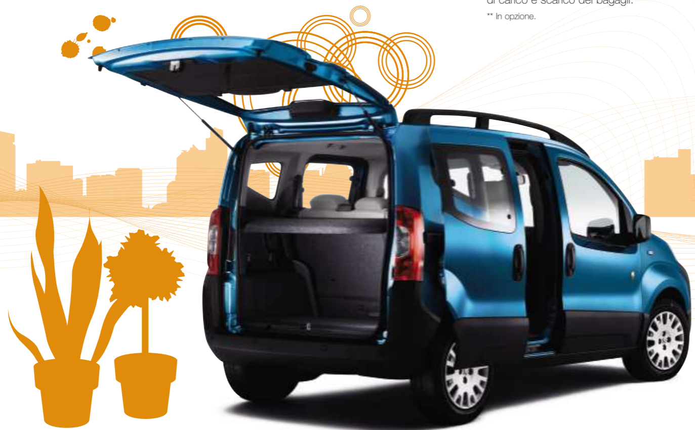
Versione Outdoor. Rilevatore di ostacoli posteriore in opzione.