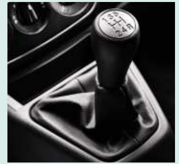
Cambio manuale a 5 marce

* Disponibile solo sull'allestimento Outdoor.