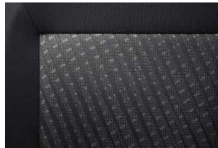
Interno C&T Marie + Orbe Tramontane - Beige (Allestimento Premium)