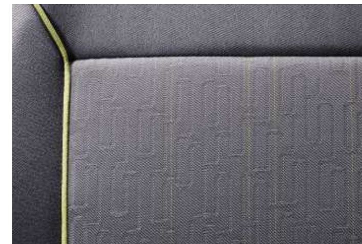
Interno C&T Trip + C&T Erbo Frissoni (Allestimento Outdoor)