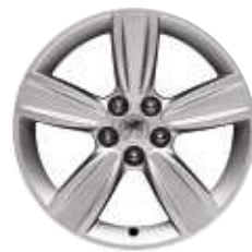
Cerchi in lega Tanganyka da 18"

(Di serie sull'allestimento Féline, in opzione sull'allestimento Tecno all'interno del Pack Confort 1 o del Pack Confort 2)