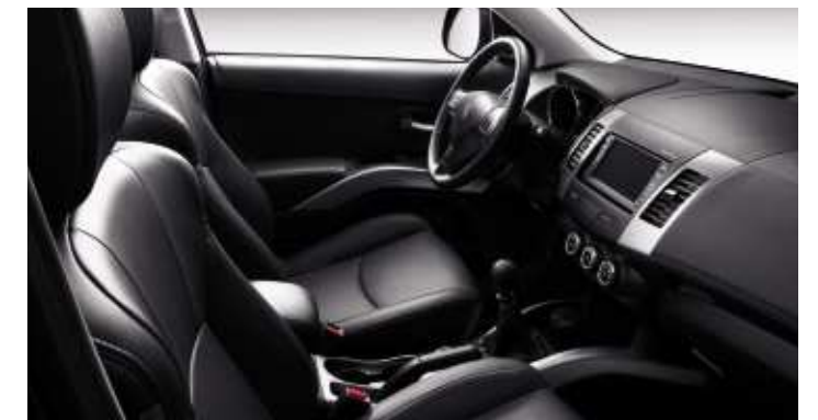
Pelle Dolce Nero - Allestimento Féline

Gli equipaggiamenti presentati in foto possono essere di serie o in opzione