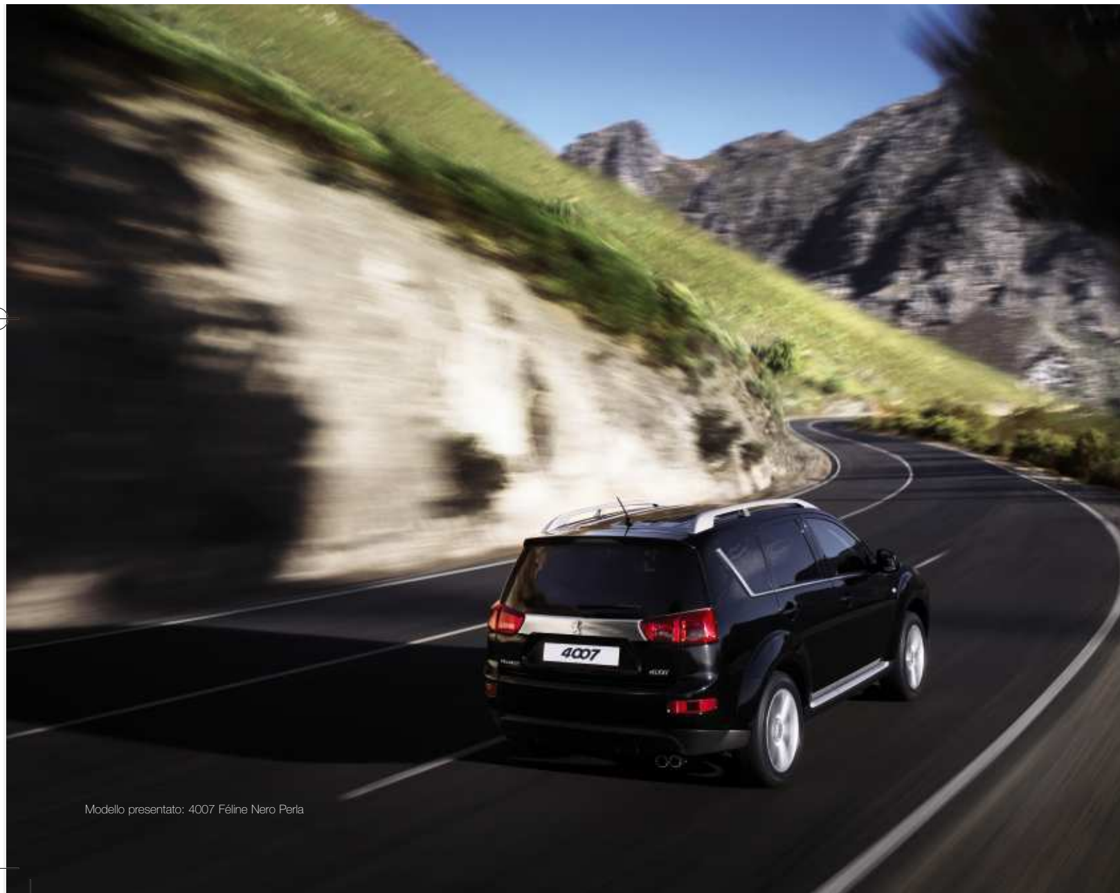
Modello presentato: 4007 Féline Nero Perla

Per ottenere ulteriori informazioni sulla vostra futura 4007, configurarla e calcolarne il prezzo in base all'allestimento e agli optional desiderati, appuntamento su www.peugeot.it .