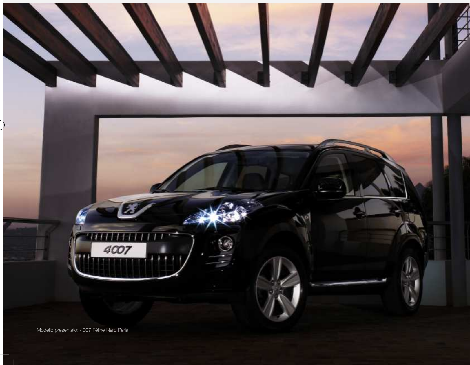
Modello presentato: 4007 Féline Nero Perla

* Disponibile di serie sulle versioni Féline o in opzione sulle versioni Tecno all'interno del Pack Confort 1 o Pack Confort 2