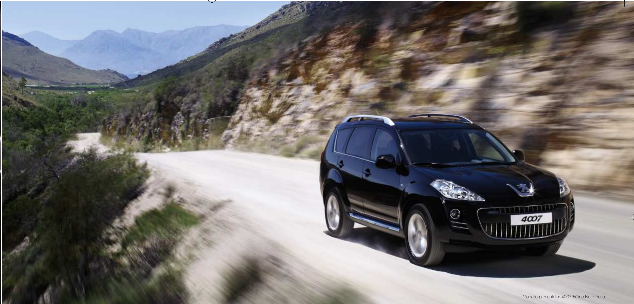
Modello presentato: 4007 Féline Nero Perla