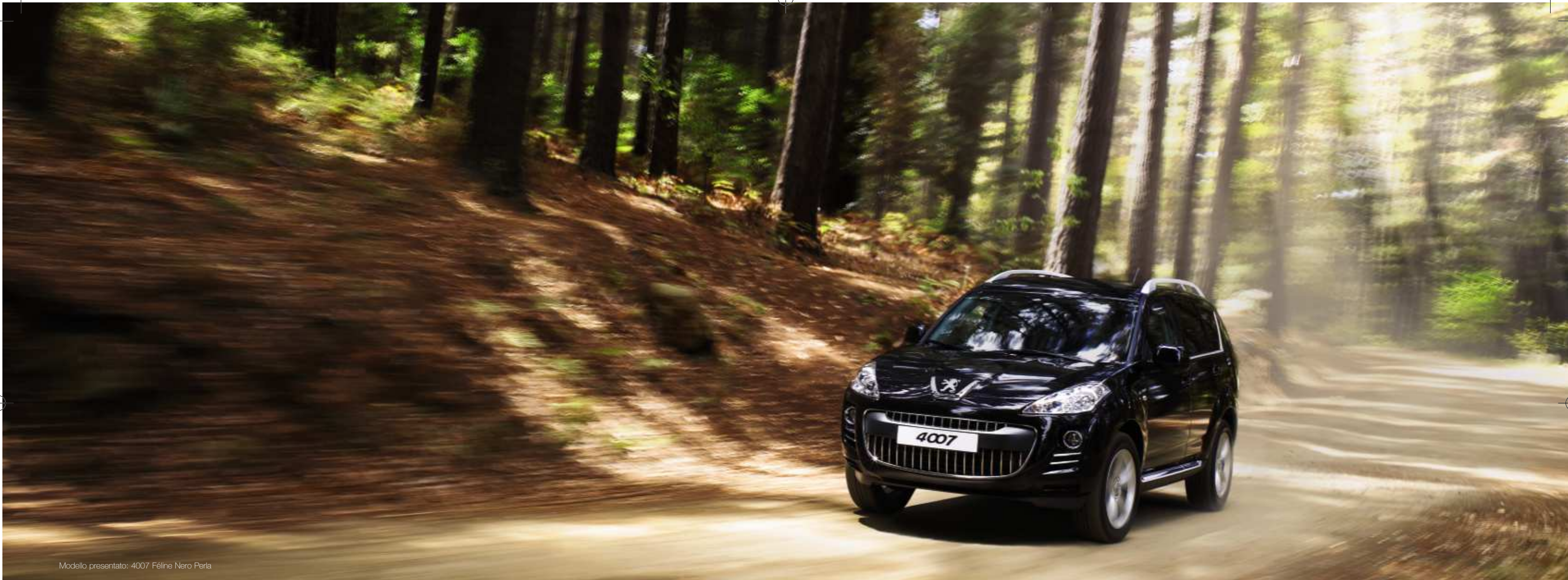
Modello presentato: 4007 Féline Nero Perla