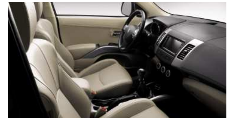
Pelle Dolce Beige - Allestimento Féline