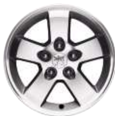
Cerchi in lega Manyara da 16"