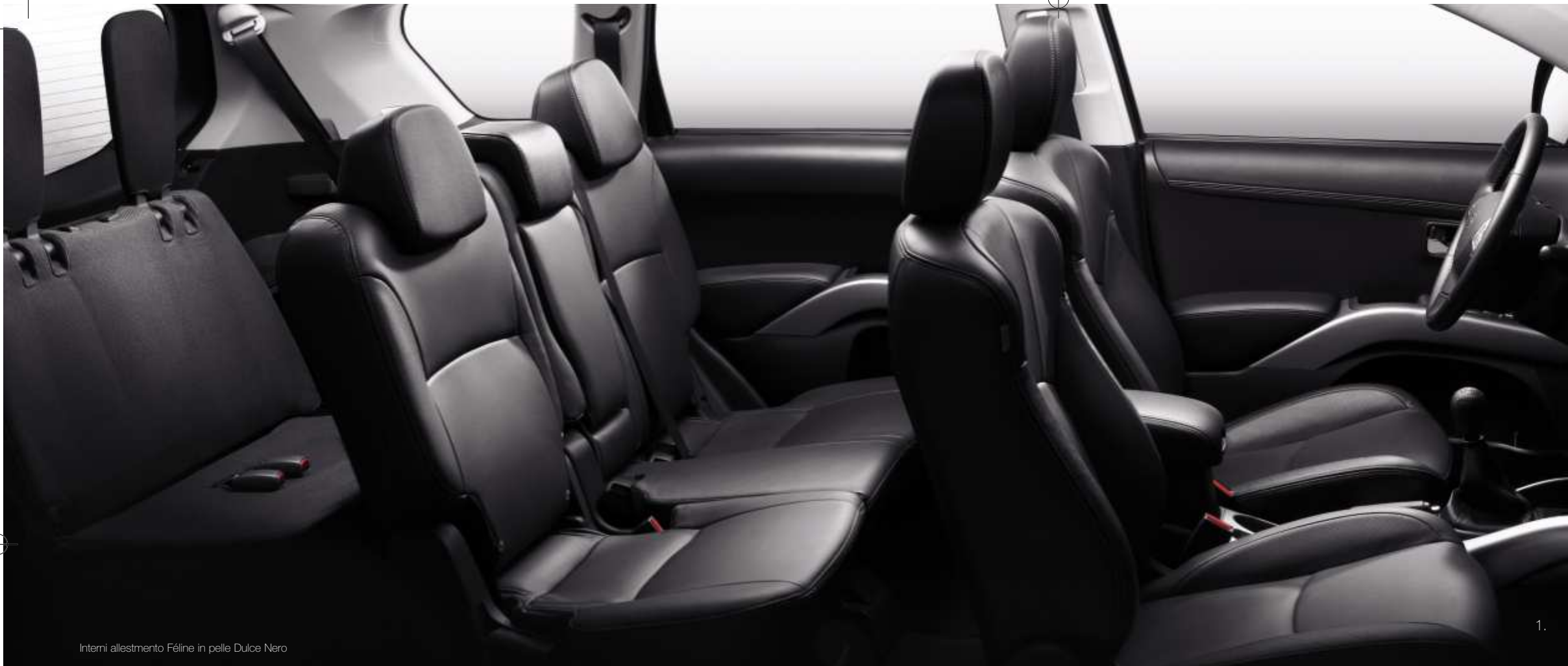
Interni allestimento Féline in pelle Dulce Nero