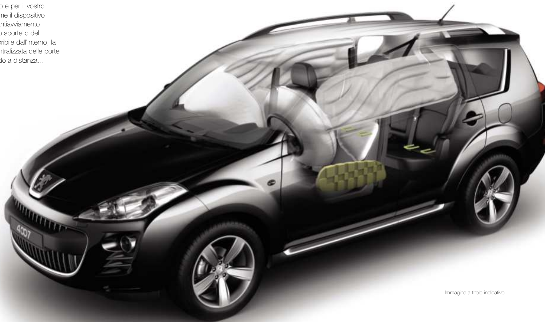
Immagine a titolo indicativo