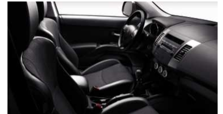
Tessuto C & T. Diamante Nero Trimatières - Allestimento Tecno