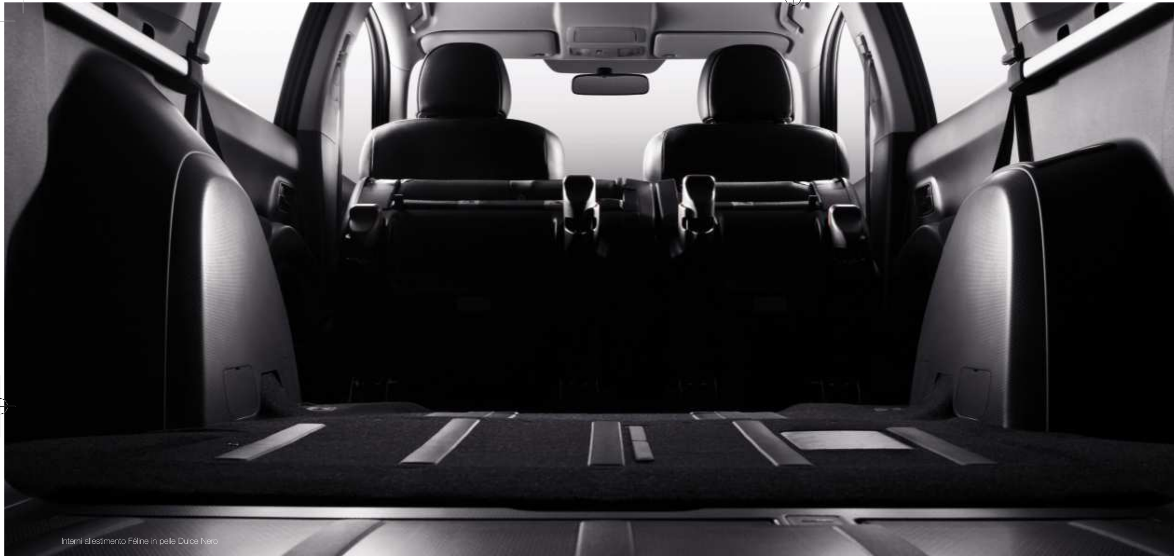
Interni allestimento Féline in pelle Dolce Nero